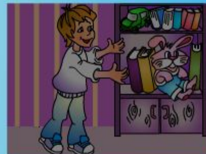
take the car