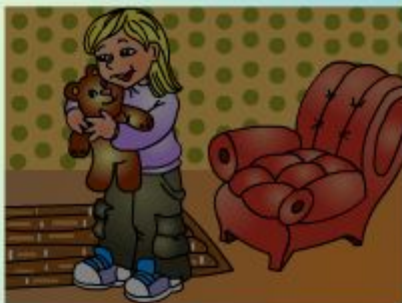
hug the teddy bear