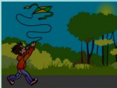
fly the kite