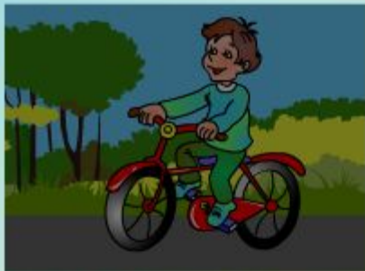
ride the bike