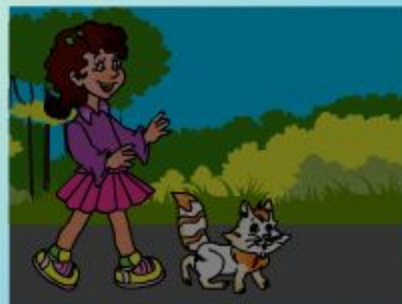
catch the cat