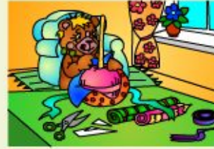
Make a present for your granny.