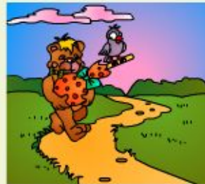
Go to your granny. Go, go, go...