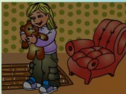
hug the teddy bear