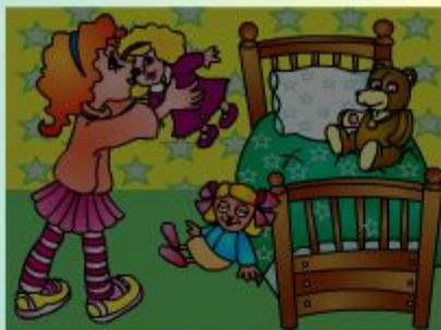
kiss the doll