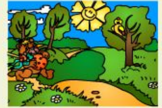
Run to your granny. Run, run, run...