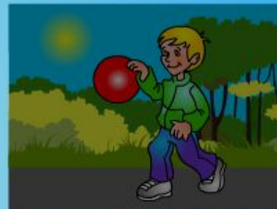
bounce the ball