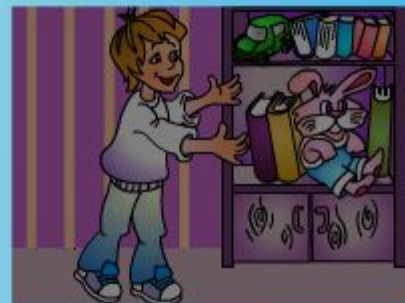
take the car