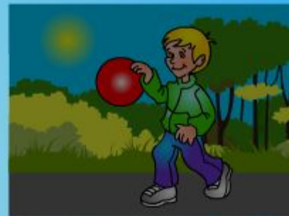
bounce the ball