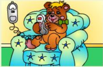
Phone your granny.