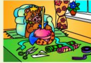
Make a present for your granny.