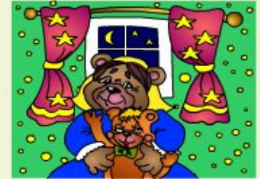
Hug your granny!