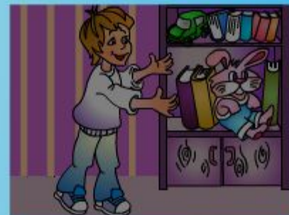
take the car