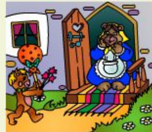
Give your granny the present.