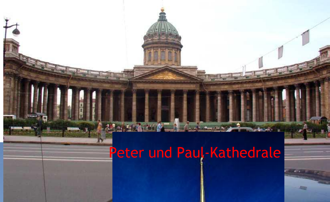
Peter und Paul-Kathedrale