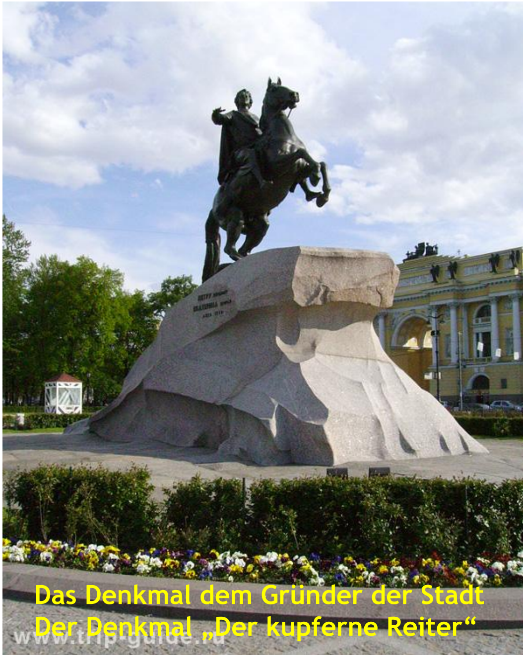
Das Denkmal dem Gründer der Stadt Der Denkmal „Der kupferne Reiter“