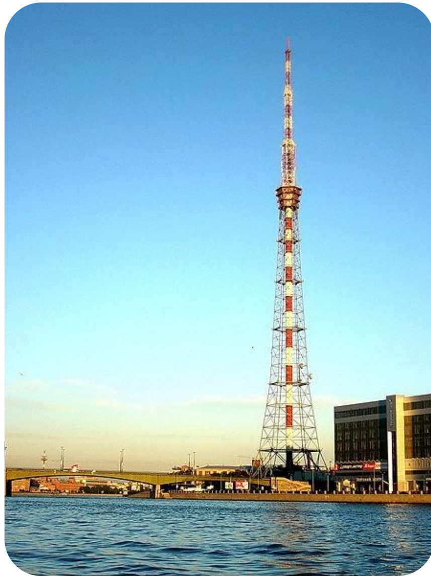
Der Fernsehturm Sankt Petersburg