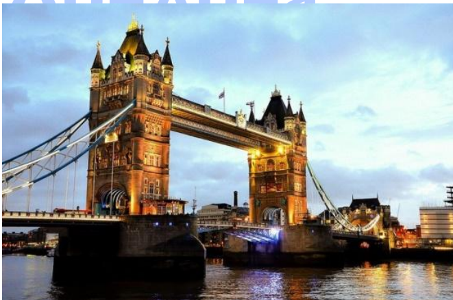
Тауэрский мост над рекой Темзой.