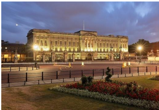
Букингемский дворец– место работы королевы.