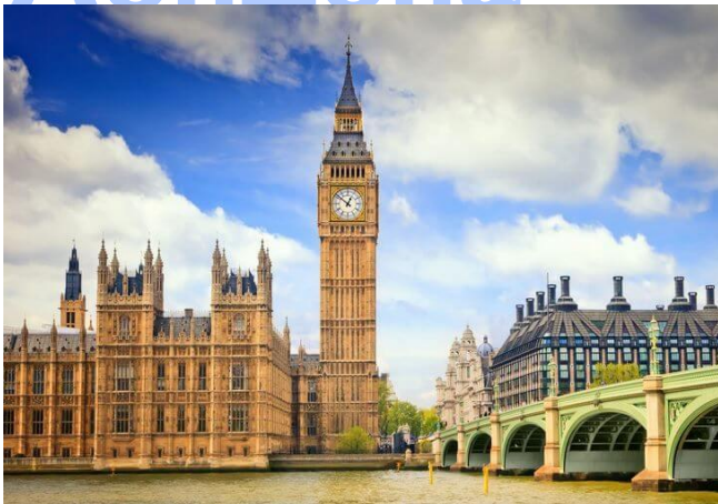
Лондонский Биг Бен – башня с часами.