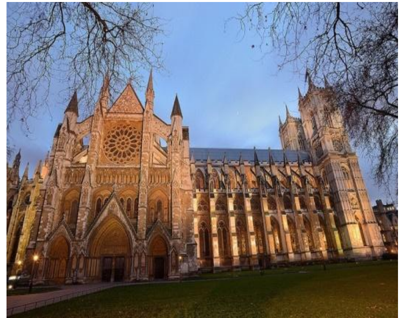
Вестминстерское аббатство – храм, в котором венчаются и коронуются английские монархи.