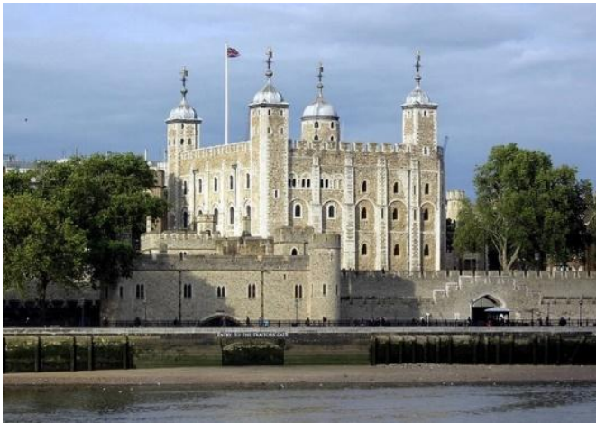
Тауэр – крепость с богатой историей.