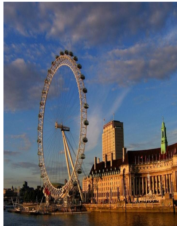
Одно из самых больших колес обозрения на планете – Лондонский глаз.