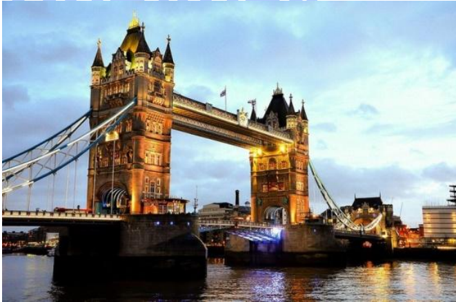
Тауэрский мост над рекой Темзой.