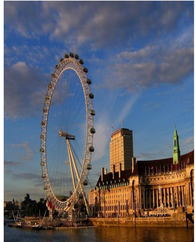
Одно из самых больших колес обозрения на планете – Лондонский глаз.