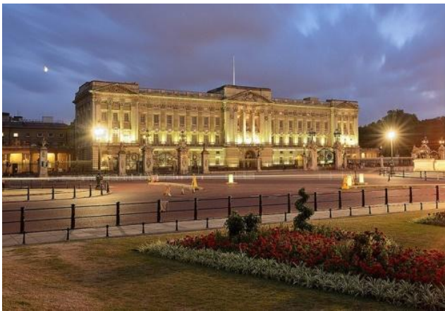
Букингемский дворец– место работы королевы.