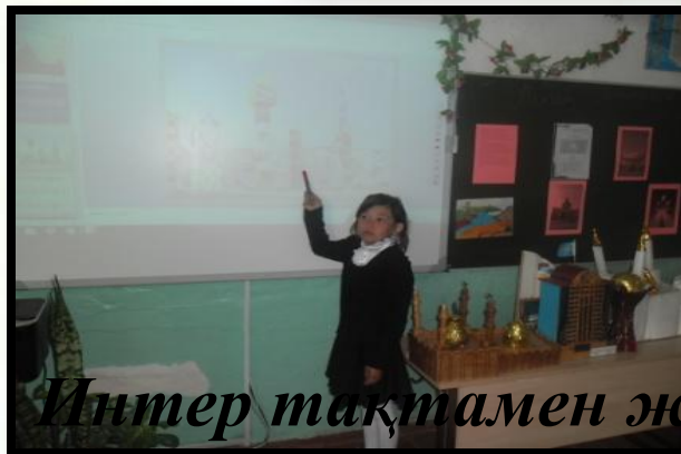
Интер тақтамен жұмыс