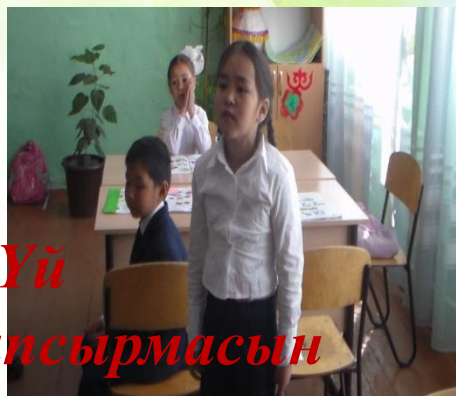
Үй тапсырмасын қайталау