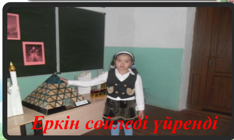
Еркін сөйледі үйренді