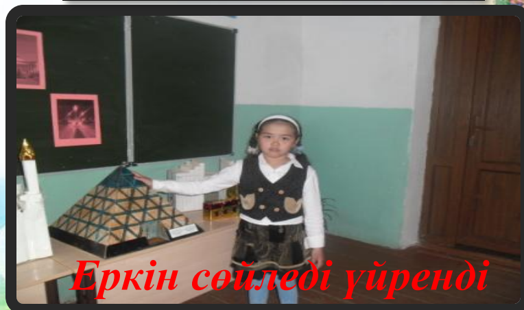
Еркін сөйледі үйренді