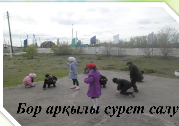
Бор арқылы сурет салу