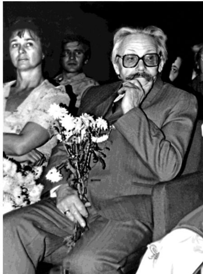
Э.Э. Каценштейн на открытии Центра немецкой культуры. Октябрь 1991 г.

Э.Э. КАЦЕНШТЕЙН УМЕР 28 ИЮЛЯ 1992. ЭТО БЫЛА ОЩУТИМАЯ ПОТЕРЯ ДЛЯ РОССИЙСКОЙ ЛИТЕРАТУРЫ. ЖИЗНЬ ЭВАЛЬДА ЭМИЛЬЕВИЧА ЯВЛЯЕТСЯ ПРИМЕРОМ ВЫСОКОГО СЛУЖЕНИЯ КУЛЬТУРЕ.