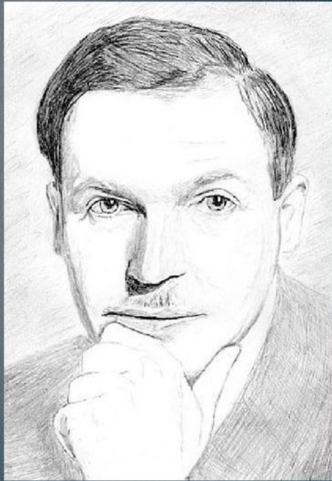
Ричард Óлдингтон (англ. Richard Aldington; настоящее имя Э́двард Го́дфри Óлдингтон; 8 июля 1892 — 27 июля 1962).