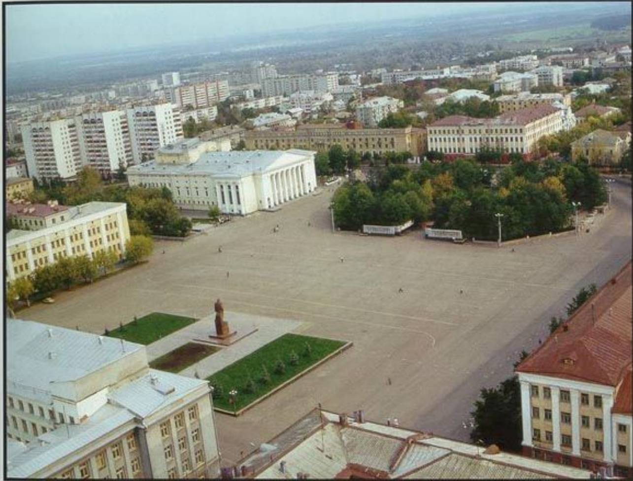
Театральная площадь.