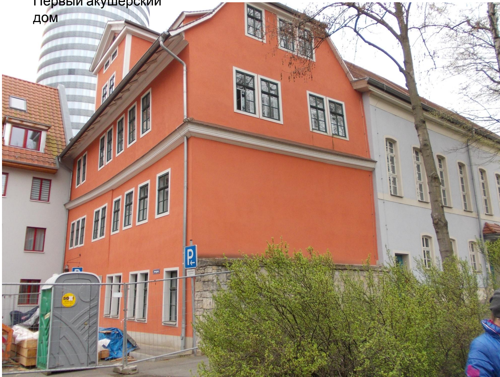
Первый акушерский дом