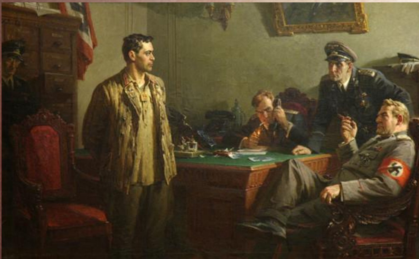
Перед приговором, 1954