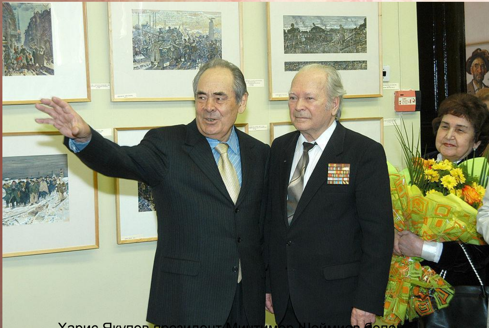
Харис Якупов президент Минтимер Шәймиев белән

■ 2010 елда вафат булды. Үлем датасы: 17 февраль 2010 (90 яшь)