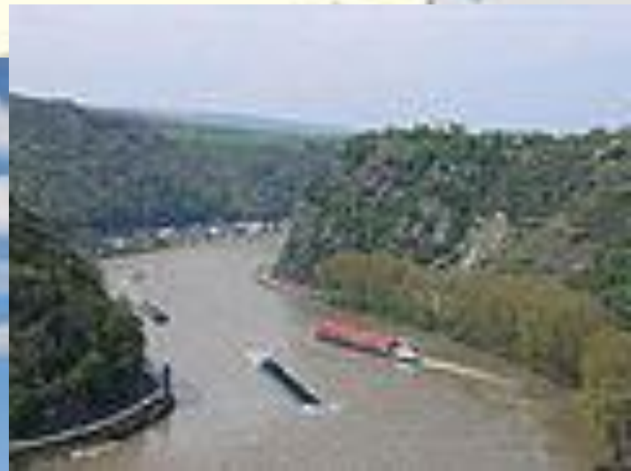
Loreleifelsen bei St. Goarshausen.