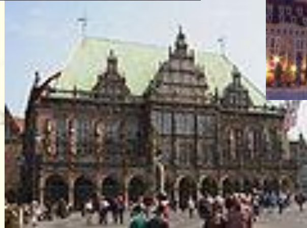
das Rathaus in Bremen