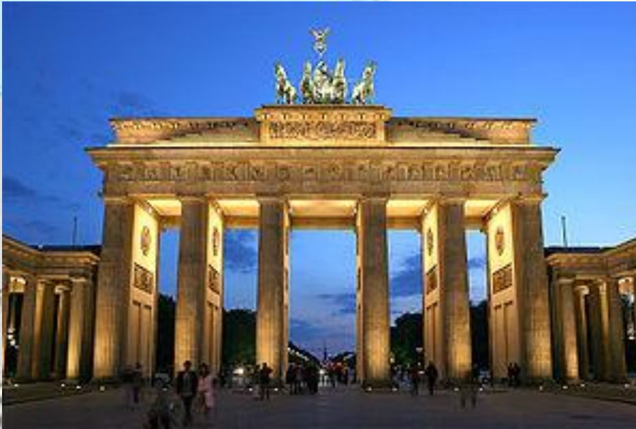
Brandenburger Tor (Berlin)