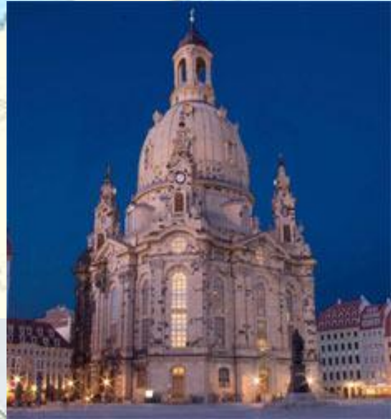
Frauenkirche ( Sachsen)