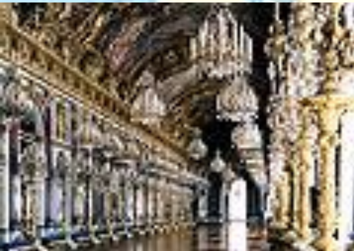
Herrenkimsee- Residenz von bayerischen König LudvigII.