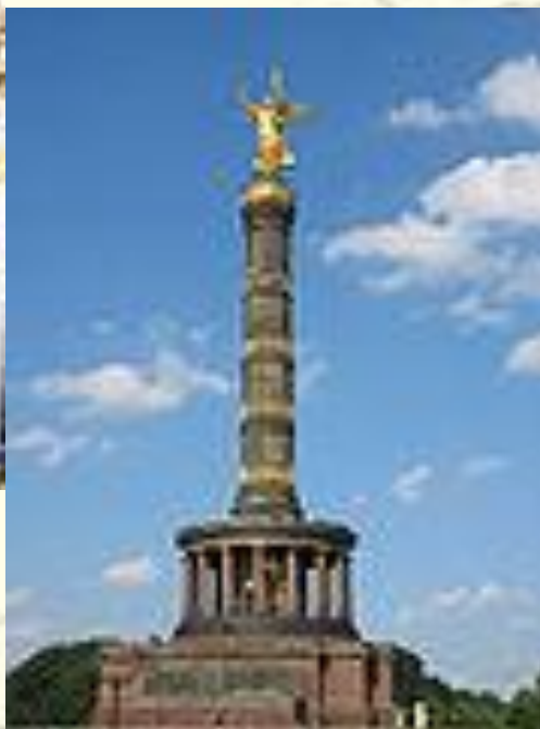
Der Siegssäule auf dem Grosse Stern Plätze in Berlin