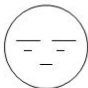
БЕЗРАЗЛИЧИЕ (мне все равно)