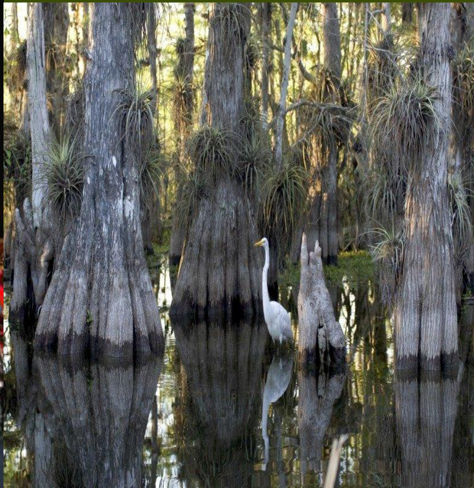
Национальный заповедник Эверглейдс