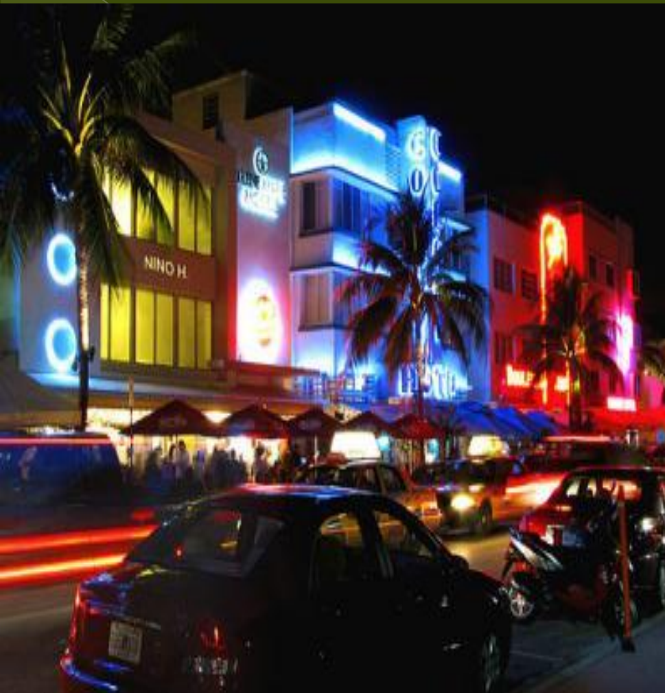
Район Арт Деко