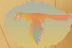
Стрельба по попуаям