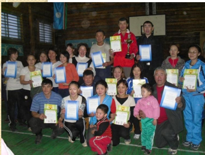
Спартакиада работников образования