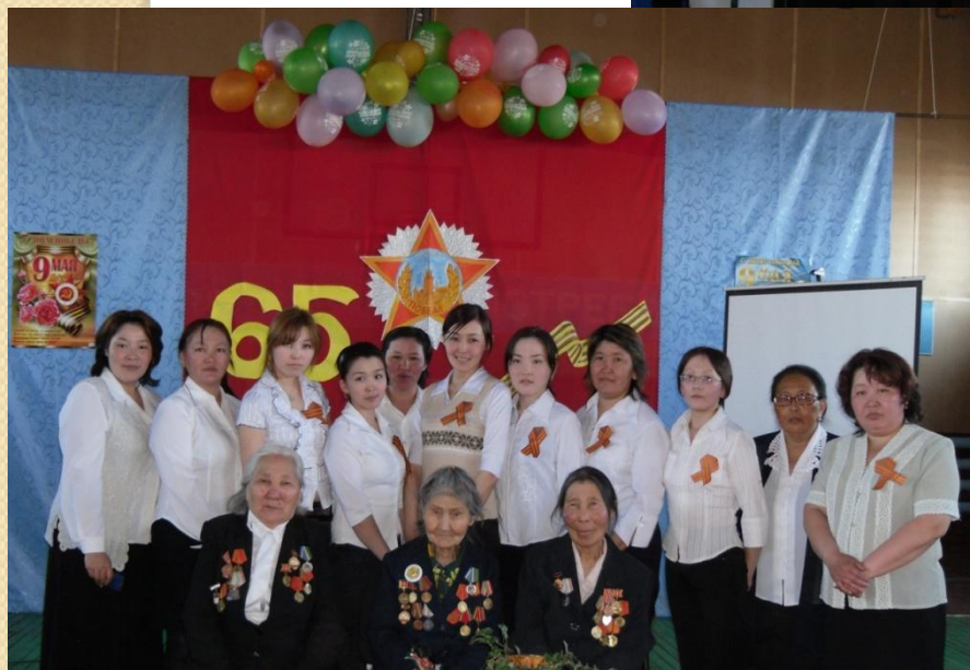
Встреча с ветеранами