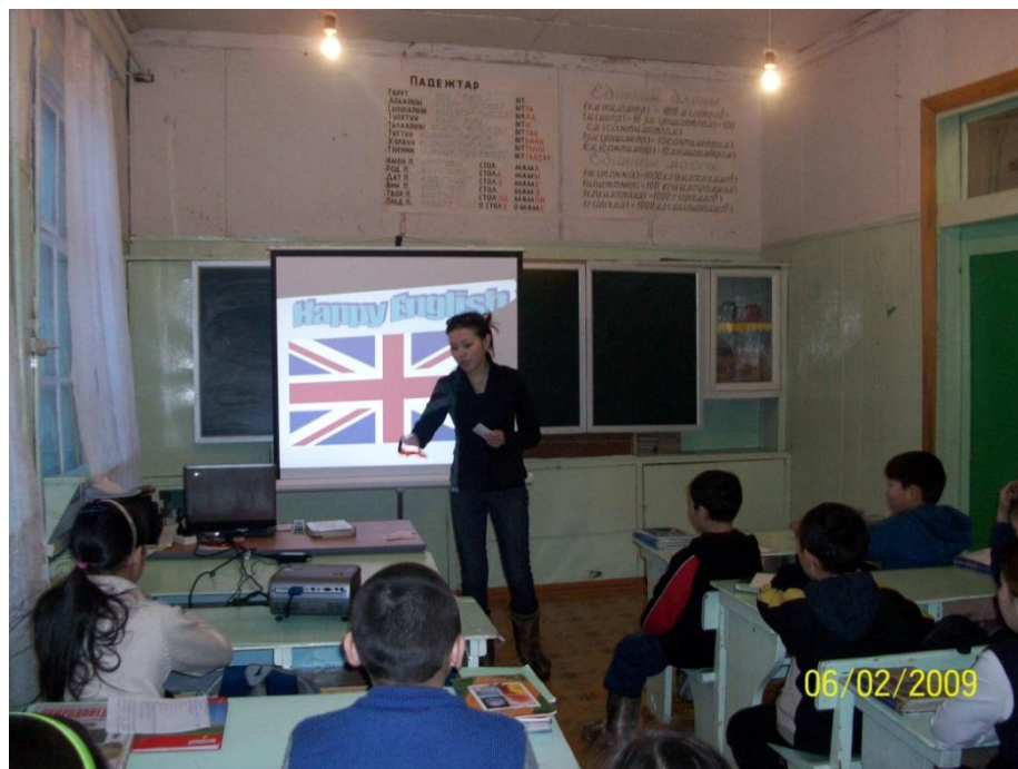
Открытый урок по теме ВКР «Использование электронных презентаций на уроках иностранного языка» (5 класс)