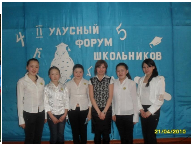
Выезд на форум