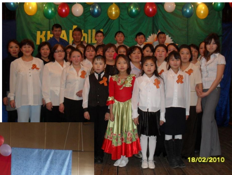
Концерт Посвященный 65 летию Победы