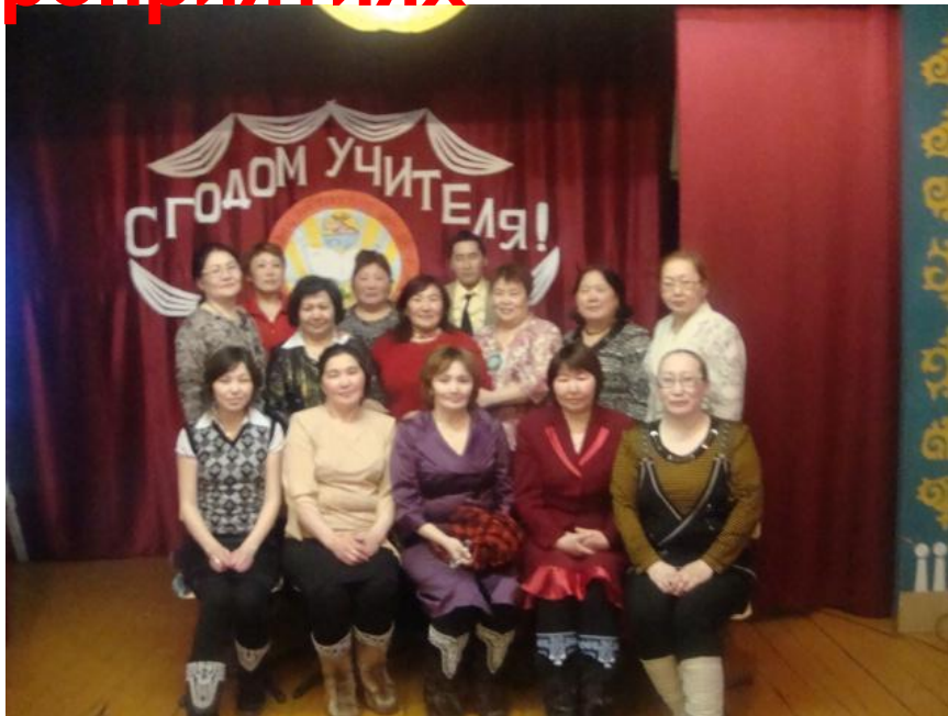
МОУ Ойсардахская СОШ