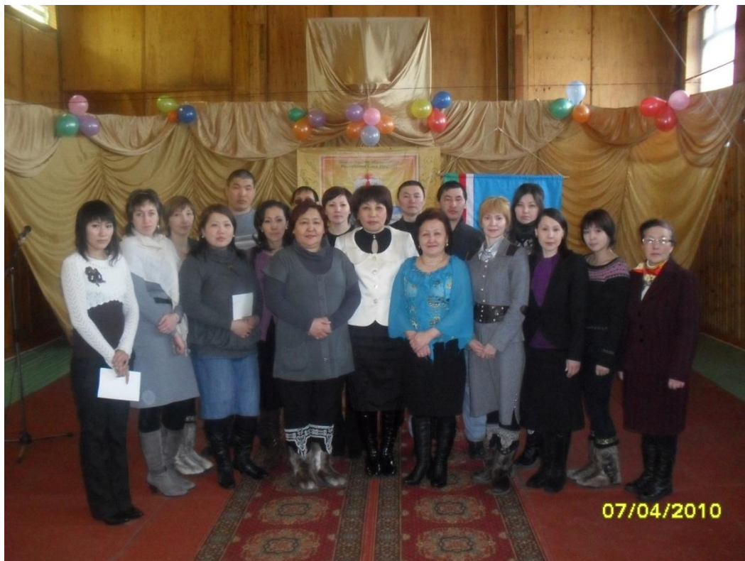
МОУ Налимская СОШ