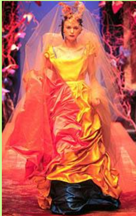
Yves Saint Laurant