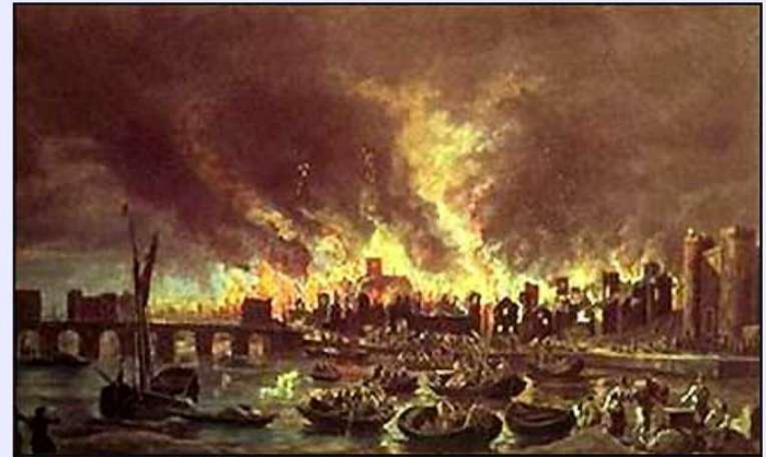
The Great Fire of London, 1666. Lieve Verschuer.

The buildings were also very close together, so the fire spread from one street to another quickly.