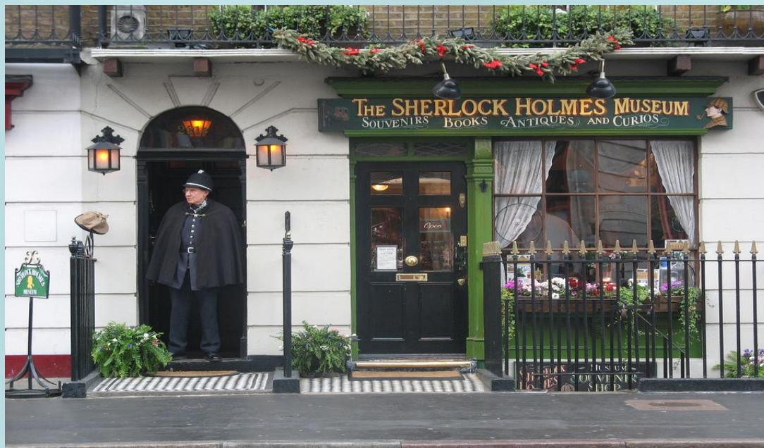
Музей Шерлока Холмса