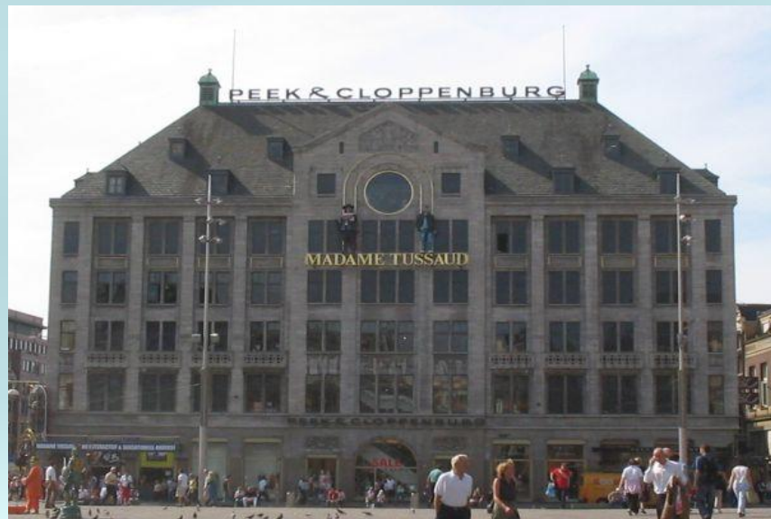
Музей восковых фигур мадам Тюссо