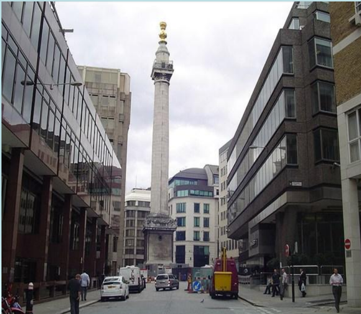
Памятник Великому лондонскому пожару 1666 г.