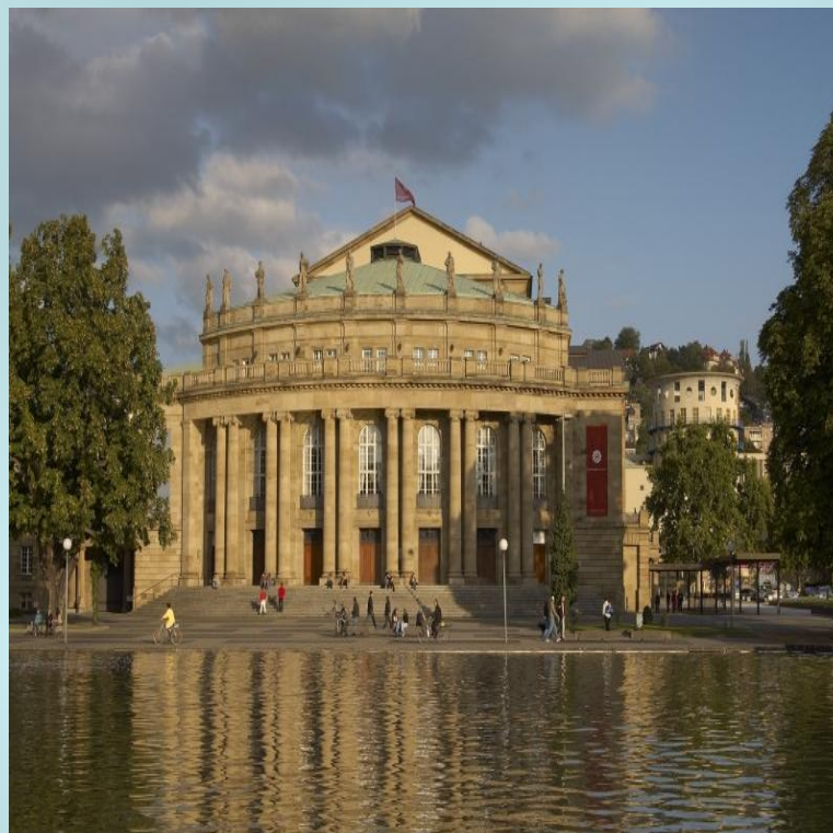
Королевский оперный театр «Ковент-Гарден»