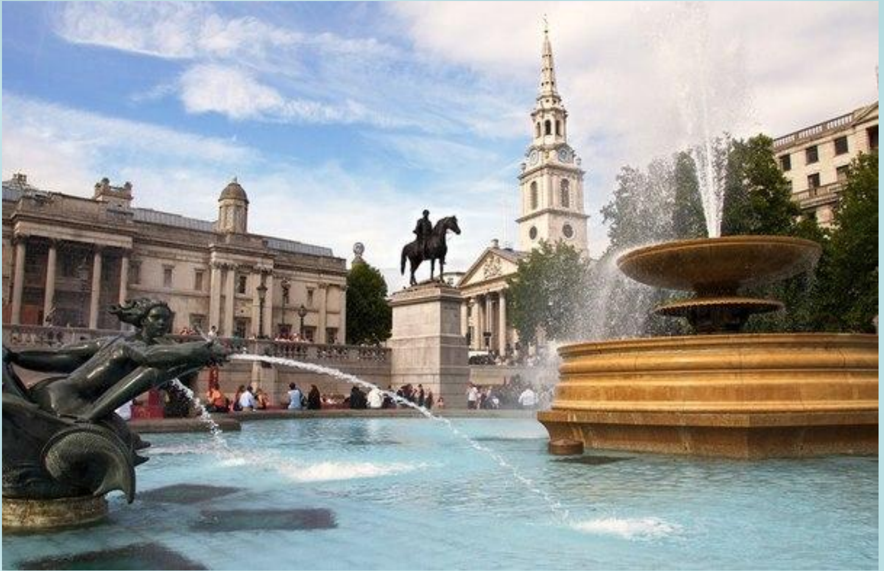
Лондонская национальная галерея Церковь Св. Мартина