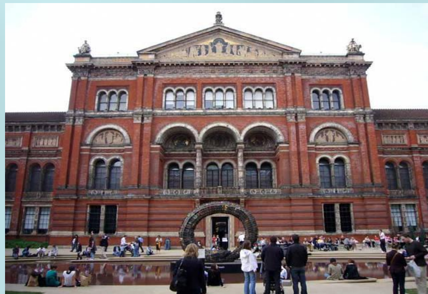
Музей Виктории и Альберта