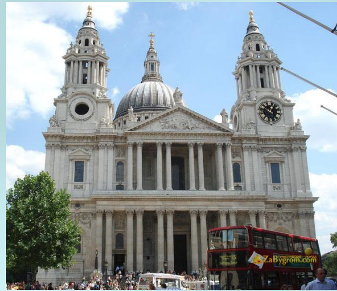
Собор Святого Павла

Территория Сити занимает одну квадратную милю, здесь проживают немногим больше тысячи человек.