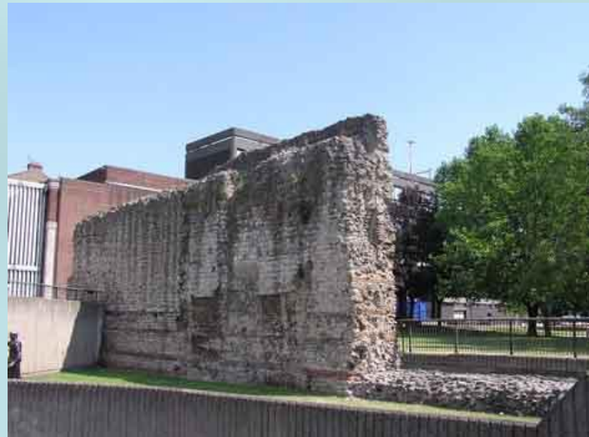
Остатки римской городской стены