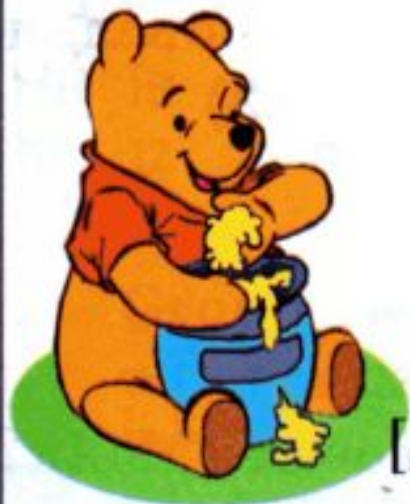
Winnie the Pooh* [,wɪni ðə 'pu:] Винни Пух