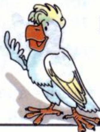
Polynesia [,pɒlɪ'ni:zə] Полинезия