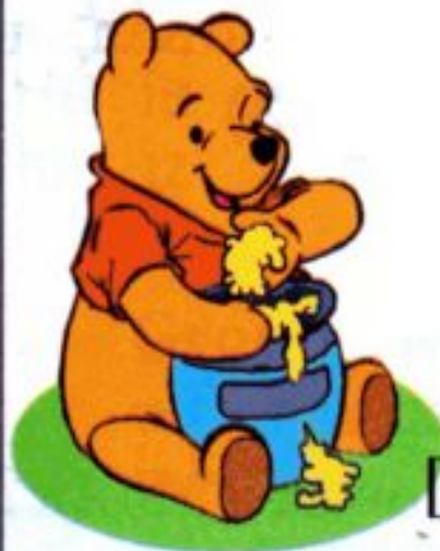
Winnie the Pooh* [,wɪni ðə 'pu:] Винни Пух