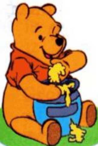
Winnie the Pooh* [,wɪni ðə 'pu:] Винни Пух