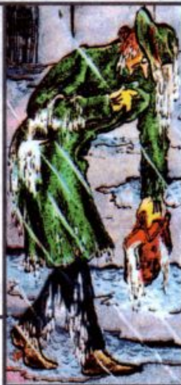
Doctor Foster [,dɒktə 'fɒstə] доктор Фостер