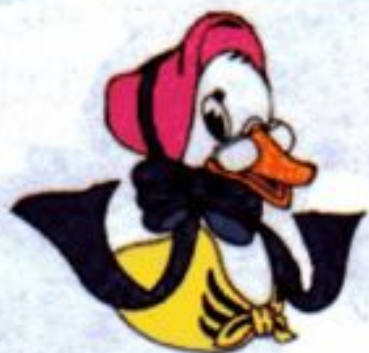
Mother Goose* [,mʌðə 'gu:z] Матушка Гусыня