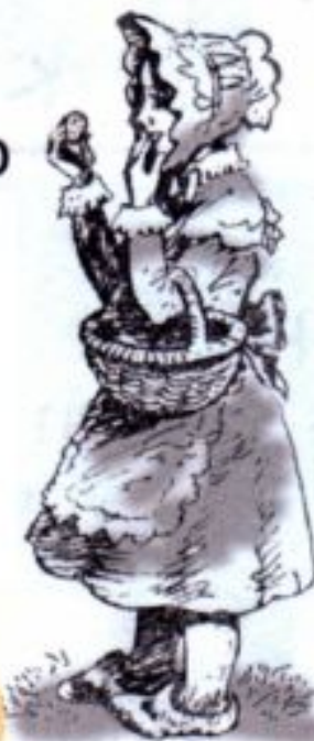
Elisabeth [ɪ'lizəbəθ] Элизабет