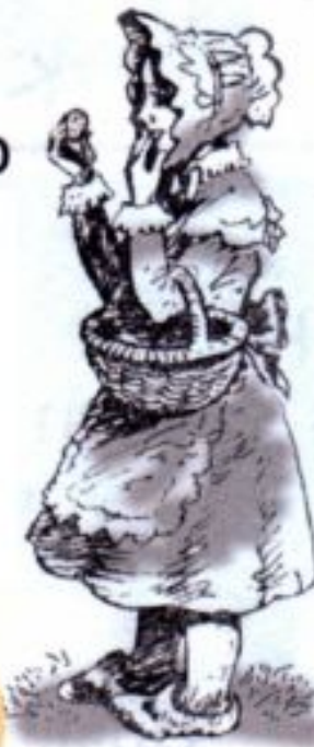
Elisabeth [ɪ'lizəbəθ] Элизабет