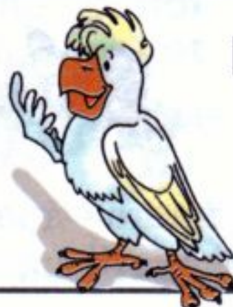
Polynesia [,pɒlɪ'ni:zə] Полинезия