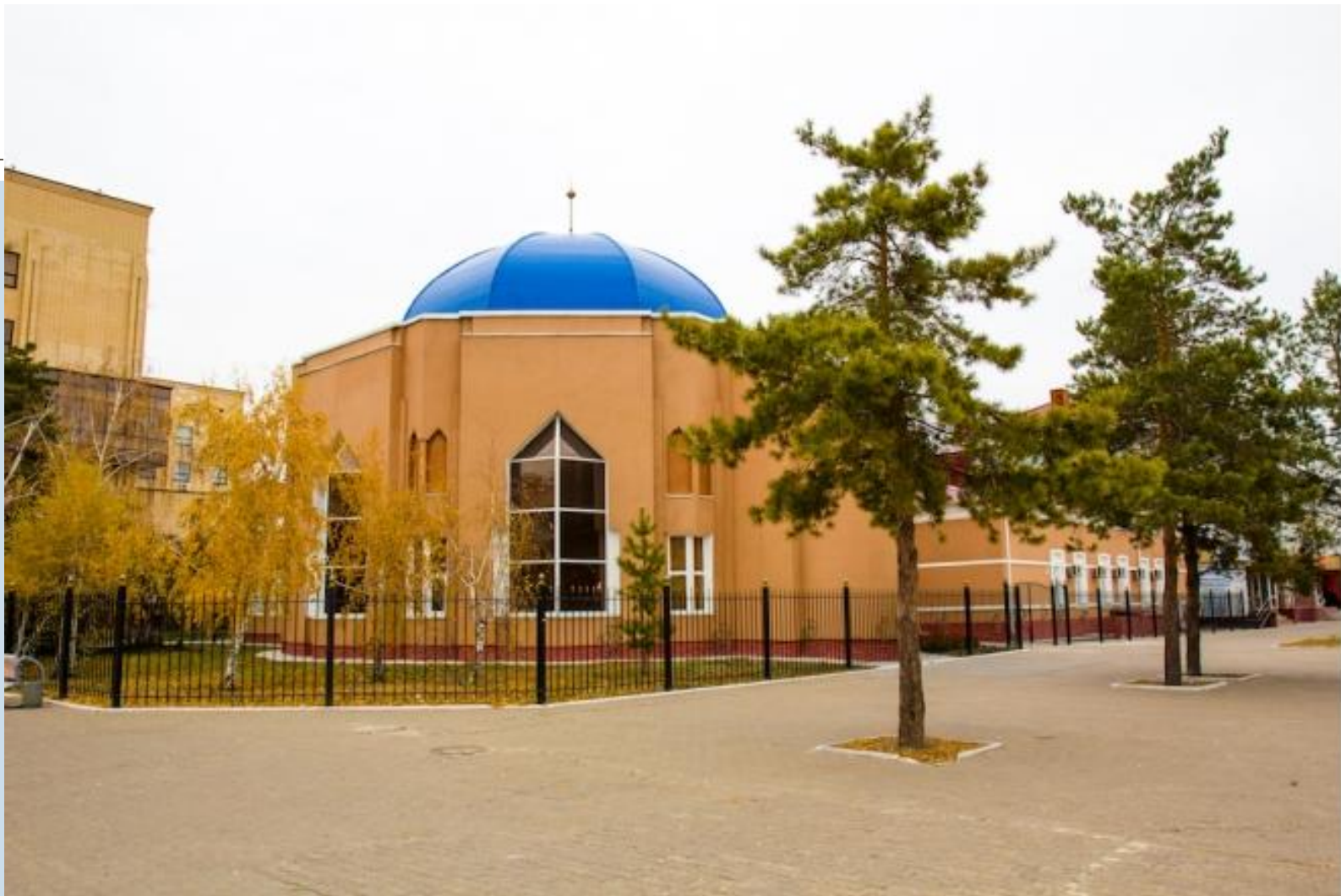
Қостанайдағы Ы.Алтынсарин музейі