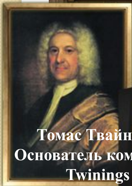
Томас Твайнинг Основатель компании Twinings