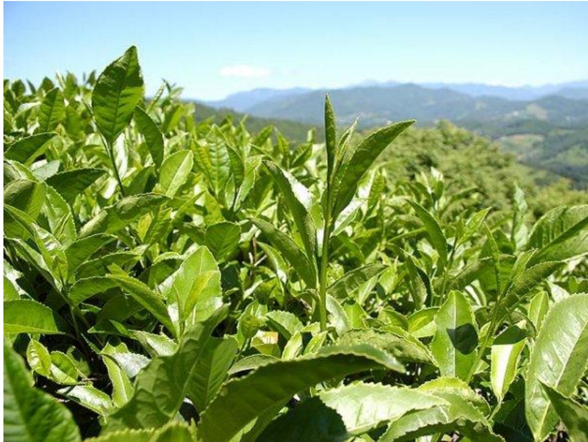
Чайные плантации в Китае

«чай» — от китайского слова «ча», что в переводе означает «молодой листочек».