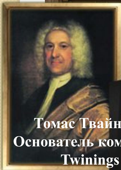
Томас Твайнинг Основатель компании Twinings