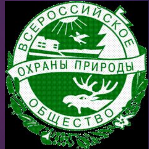
Russian Society for Nature Conservation