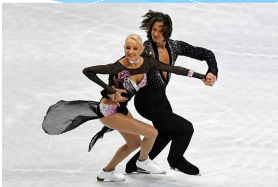
figure (фигура) + skate (катание)