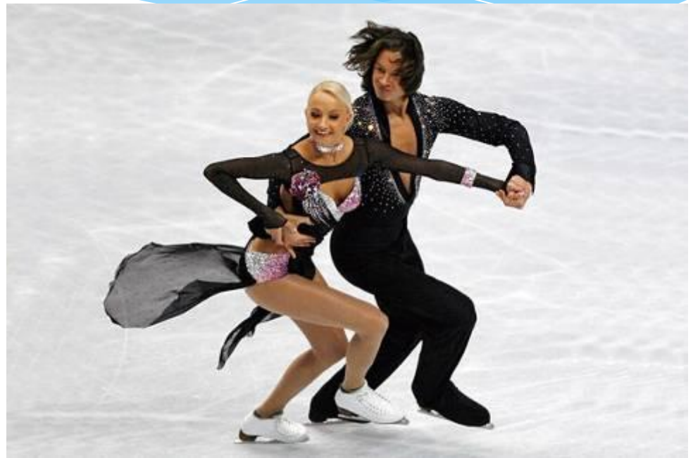
figure (фигура) + skate (катание)