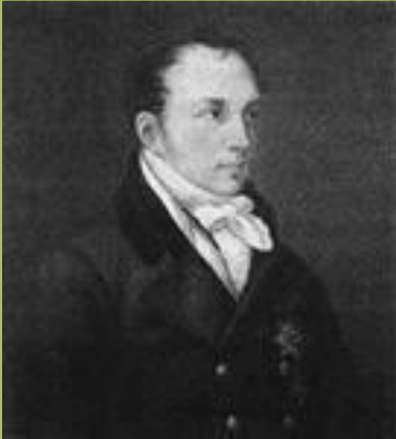
Профессор Александр Петрович Куницын.

«Куницыну дань сердца и вина! Он создал нас, он воспитал наш пламень. Поставлен им краеугольный камень, Им чистая лампада возжена...»