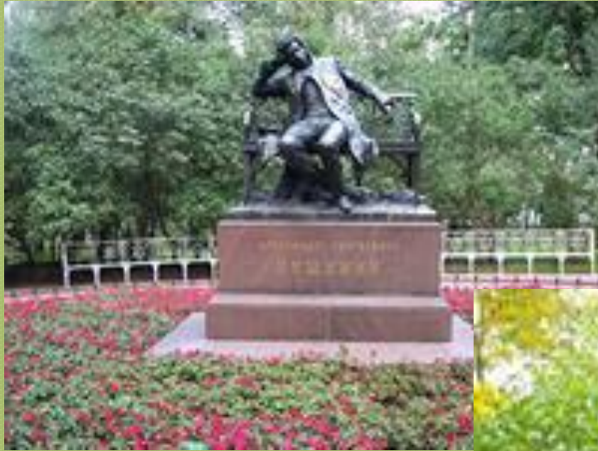
Памятник Пушкину в Царском Селе (ныне город Пушкин).