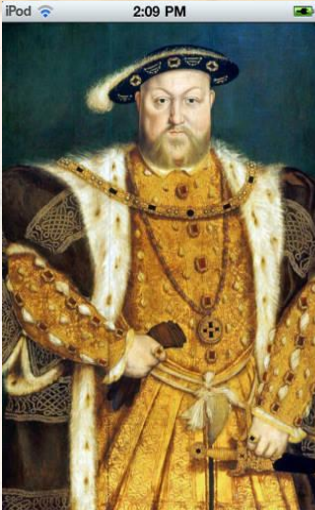
Король Англии Генрих VIII Тюдор (1491 -1547гг.)

Многие считают, что Генрих VIII создал Церковь Англии в XVI веке, чтобы обеспечить свой развод с Екатериной Арагонской. Поскольку он уже сожительствовал со своей любовницей Анной Болейн (второй из его шести жён), Генрих VIII хотел «аннулирования» законного брака — декларации католического духовенства, что они вообще не были венчаны согласно закону. К этому времени католическая церковь в Англии существовала уже около 900 лет.