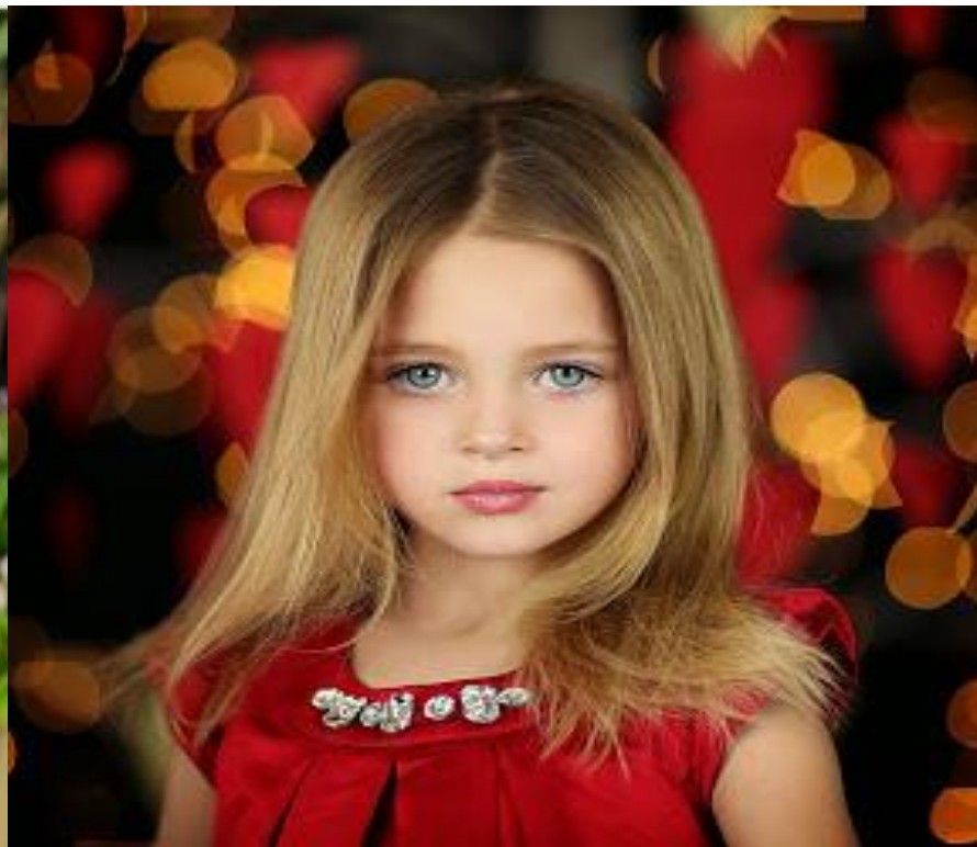
DAUGHTER ['dɔ:tər] УРУУ