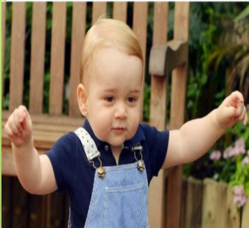
Son [sʌn] ОҒЛУ