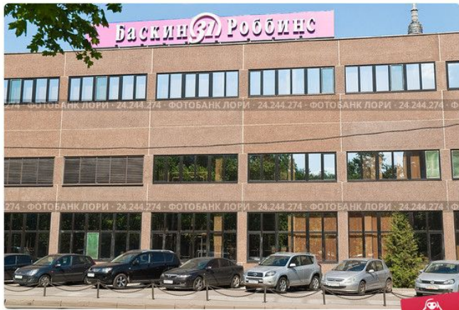
Фабрика мороженого "Баскин-Роббинс" на Огородном проезде в Москве