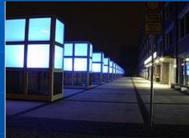
Nächtliches Lichtspiel vor der Zentralbibliothek der TU und Udk