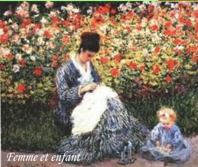
Femme et enfant