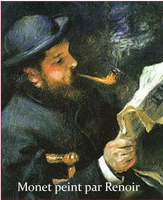
Monet peint par Renoir