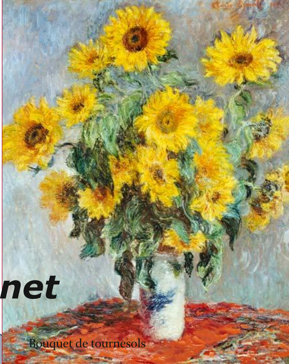
Bouquet de tournesols