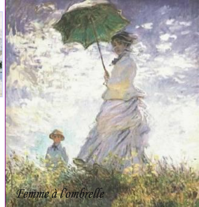
Femme à l'ombrelle