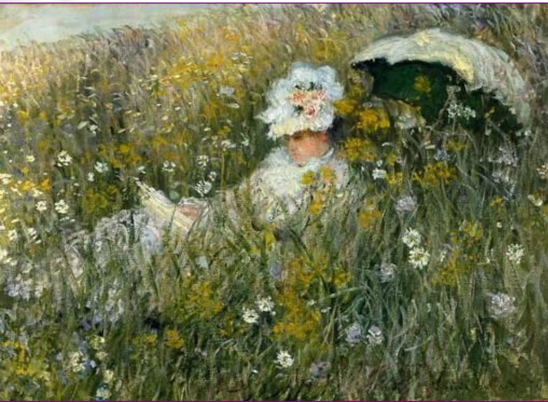
Dans le pré de fleurs ( Dans la Prairie )