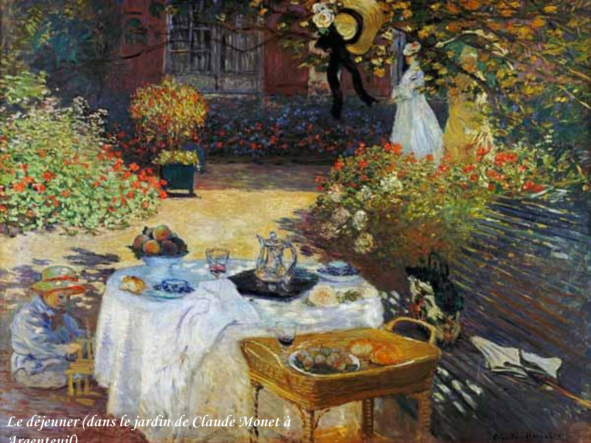
Le déjeuner (dans le jardin de Claude Monet à Argenteuil)