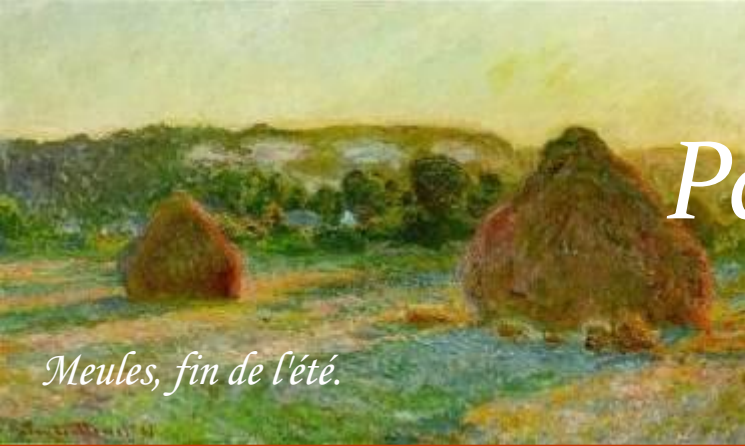
Meules, fin de l'été.