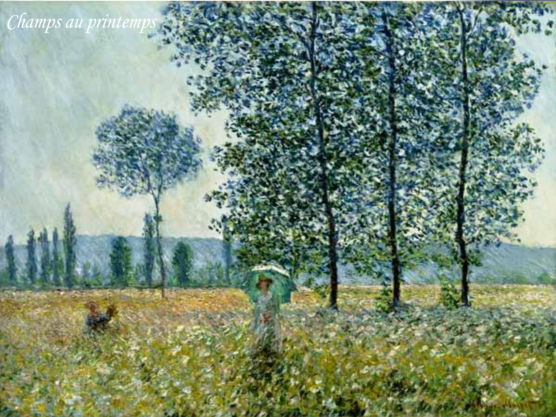
Champs au printemps