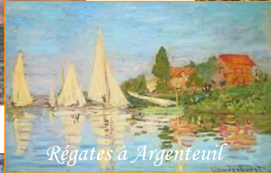
Régates à Argenteuil