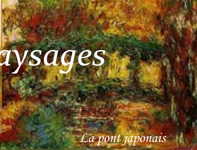
La pont japonais