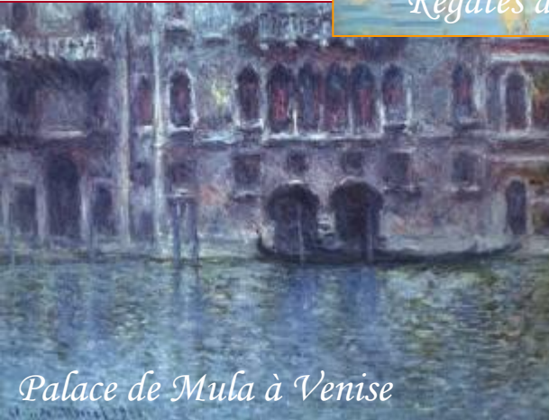
Palace de Mula à Venise