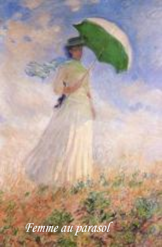
Femme au parasol