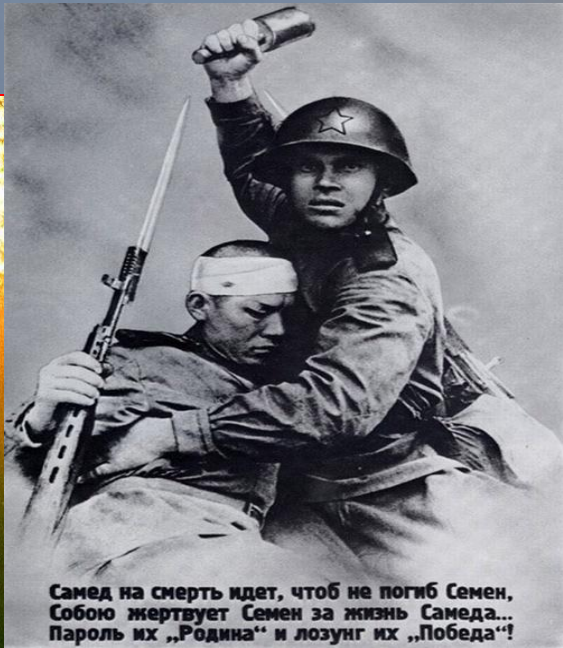
Самед на смерть идет, чтоб не погиб Семен, Собою жертвует Семен за жизнь Самеда... Пароль их „Родина“ и лозунг их „Победа“!