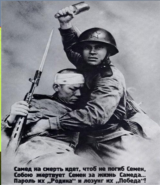
Самед на смерть идет, чтоб не погиб Семен, Собою жертвует Семен за жизнь Самеда... Пароль их „Родина“ и лозунг их „Победа“!