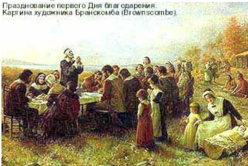
Празднование первого Дня благодарения. Картина художника Бранскомба (Branscombe).