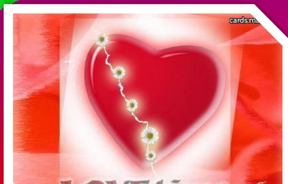
«St. Valentine's Day»