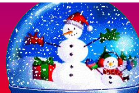
«HAPPY NEW YEAR!»