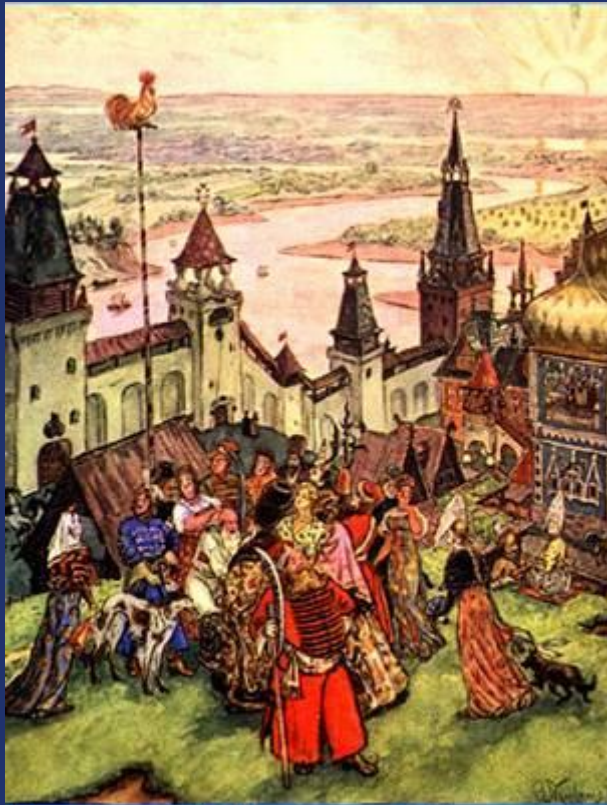
Иллюстрация В. А. Милашевского к «Сказке о золотом петушке».

„Петушок с высокой спицы Стал стеречь его границы. Чуть опасность где видна, Верный сторож как со сна Шевельнётся, встрепенётся, К той сторонке обернётся И кричит: “Кири-ку-ку. Царствуй, лёжа на боку!” И соседи присмирели, Воевать уже не смели: Таковой им царь Дадон Дал отпор со всех сторон! „