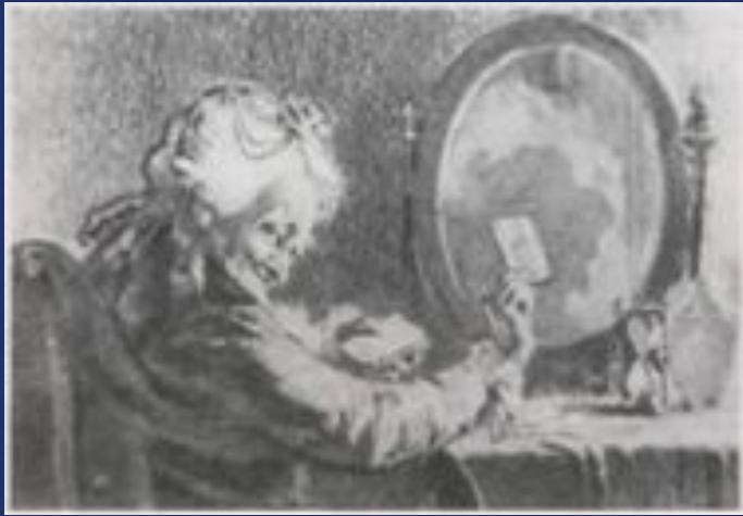
A. S. Puschkin „Pikdame“