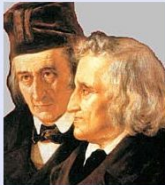
Якоб и Вильгельм Гримм — немецкие ученые и писатели.

Und jetzt fahren wir nach Hause. Wir sagen nicht „Auf Wiedersehen, Märchenland!“ Wir fahren dorthin noch einmal am Ende Dezember. Wir besuchen Deutschland und die Brüder Grimm.