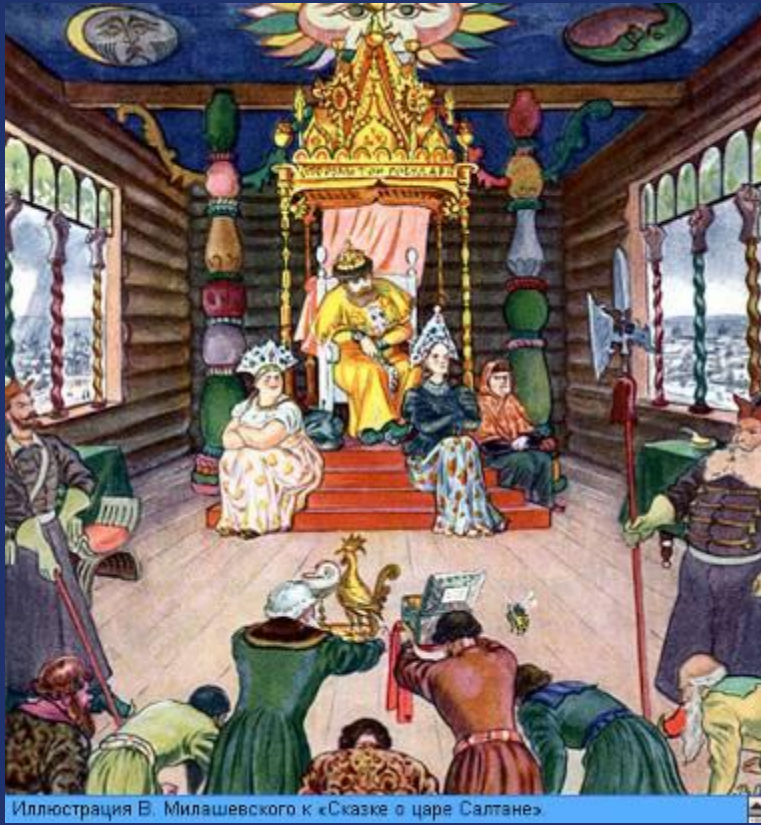
Иллюстрация В. Милашевского к «Сказке о царе Салтане»

Вот на берег вышли гости; Царь Салтан зовёт их в гости, И за ними во дворец Полетел наш удалец. Видит: весь сияя в злате, Царь Салтан сидит в палате На престоле и в венце, С грустной думой на лице; А ткачиха с поварихой, С сватьей бабой Бабарихой Около царя сидят И в глаза ему глядят.