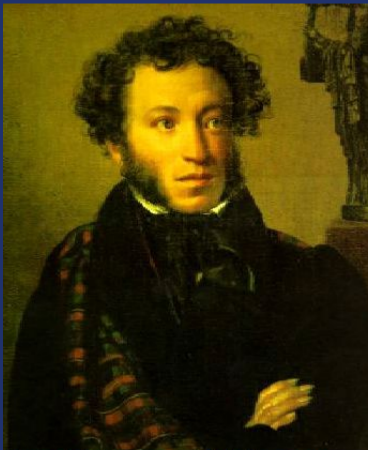
Портрет А. С. Пушкина работы О. А. Кипренского. 1827. Третьяковская галерея.