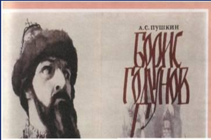
A. S. Puschkin „Boris Godunow“

Von den Puschkinsmärchen, die wir in der Kindheit gelesen haben, ist der direkte Weg zum erwachsenen Puschkin mit seinem Reichtum der Gestalten.