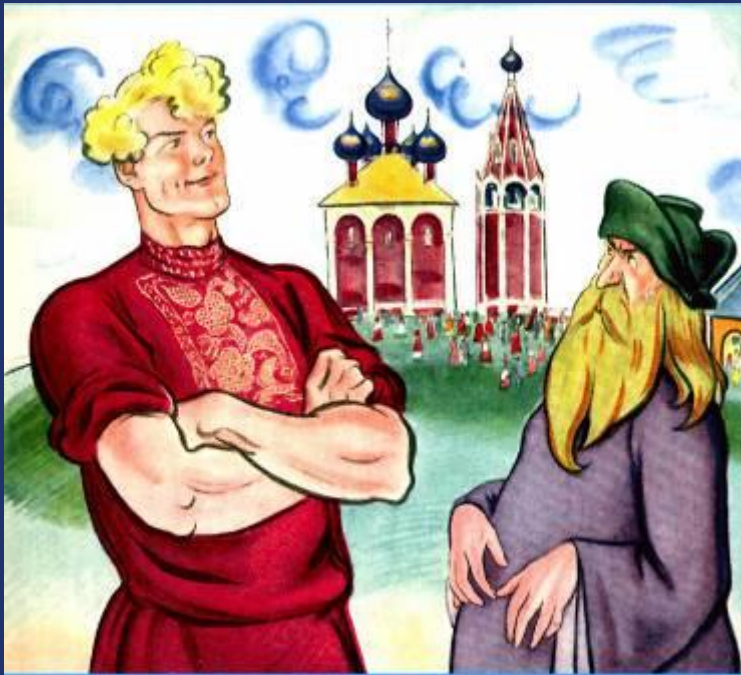
Иллюстрация Э. Милешавского к «Сказке о попе и о работнике его Балде»