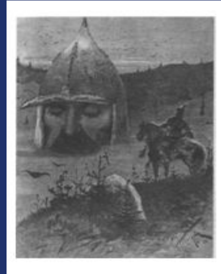
A.S. Puschkin „Ruslan und Ludmila“