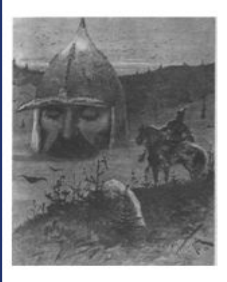
Иллюстрация к поэме «... и Людмила»