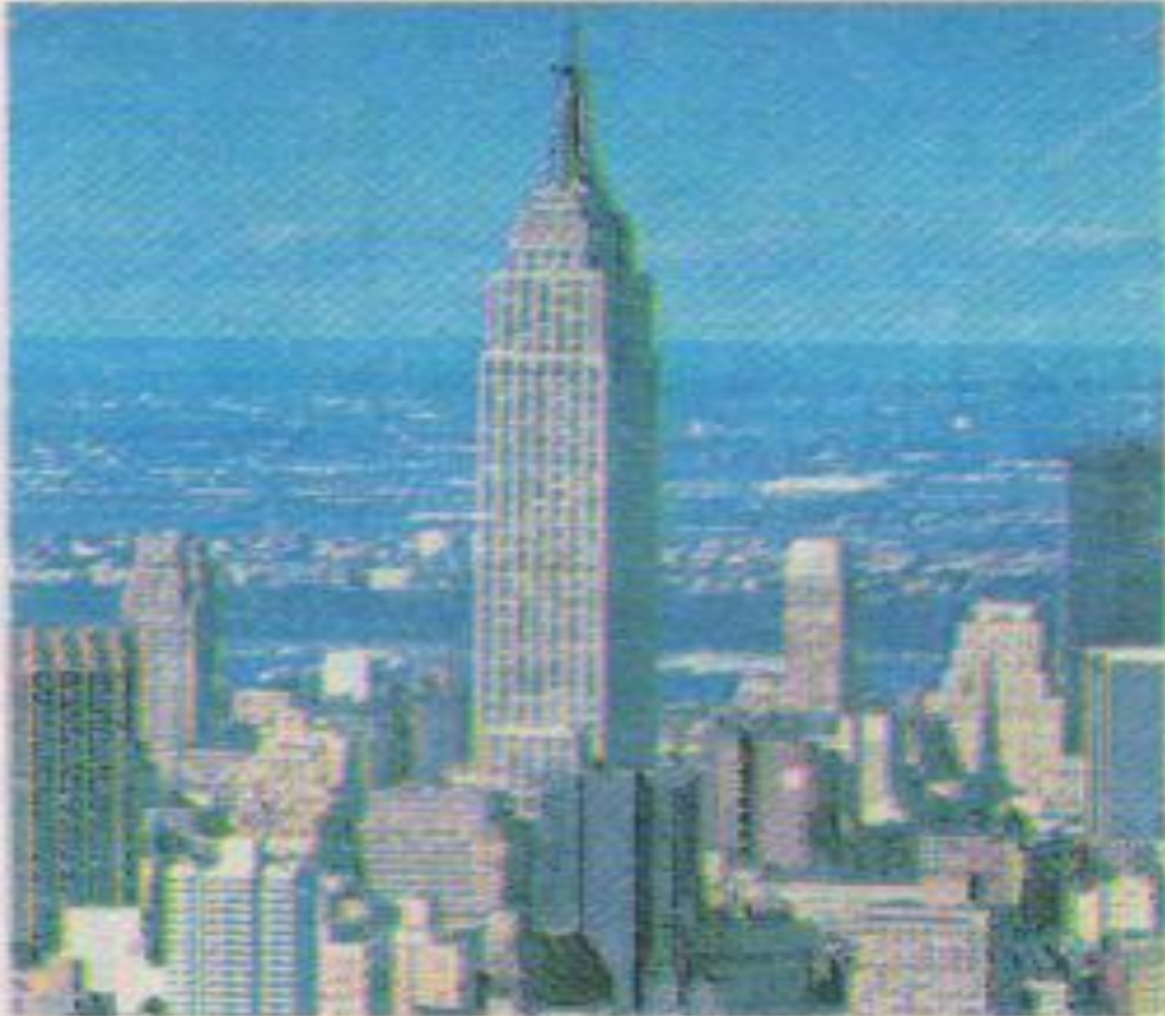
The Empire State Building

It is the most famous building in the world. It's very tall. Here you can visit the Observatory. Visibility on clear day- 80 miles. The Observatory is on the 102 nd floor of the Empire state Building. it's the worlds greatest TV tower. It is 1, 454 feet tall.