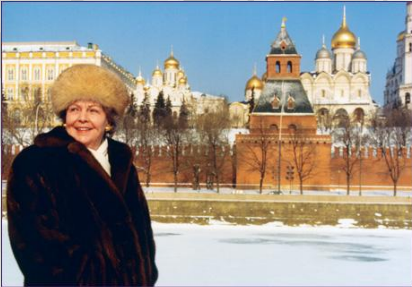
Aenne Burda vor dem Kreml