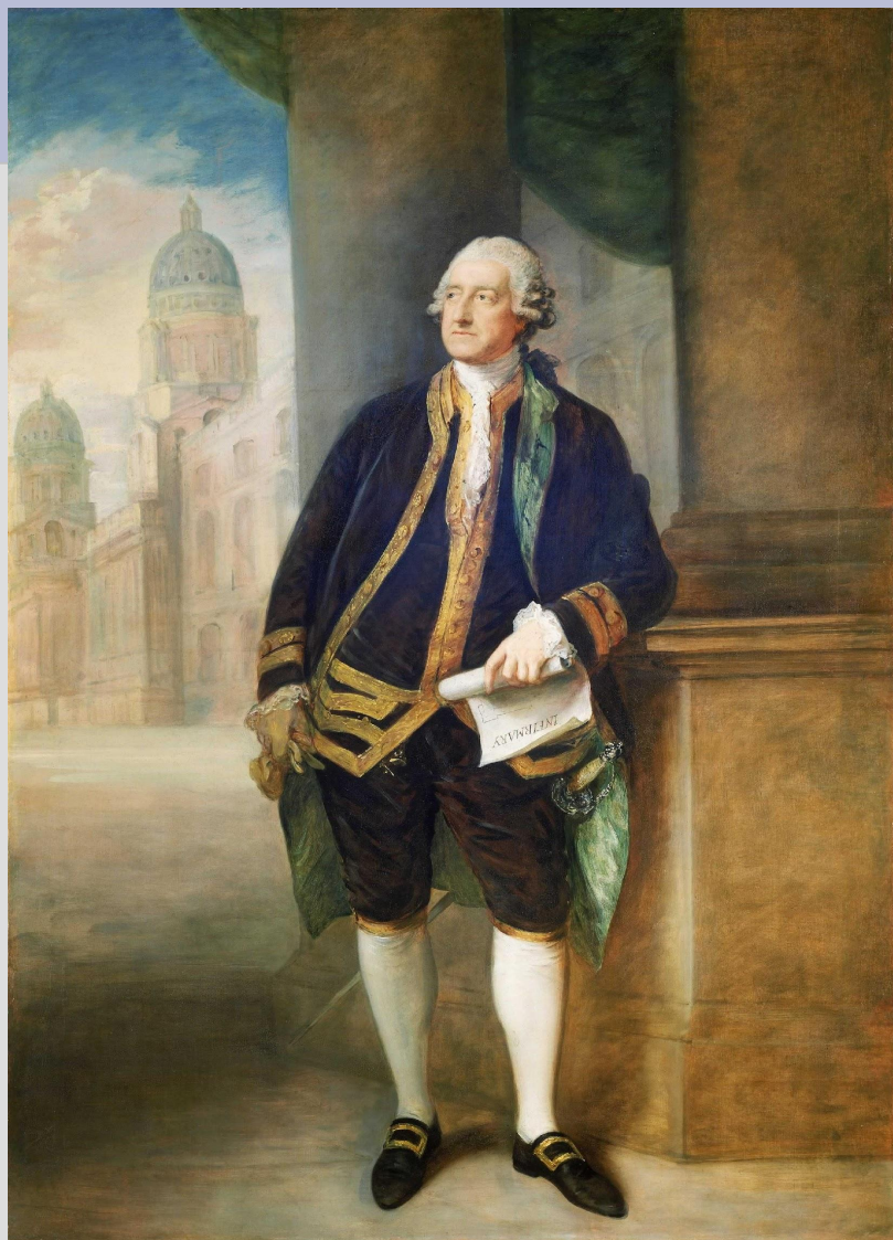
Джон Монтегю, 4-й граф Сэндвич 1718 – 1792