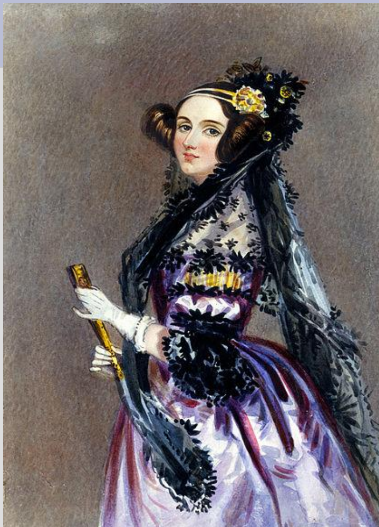
Августа Ада Кинг графиня Лавлейс 1815 – 1852