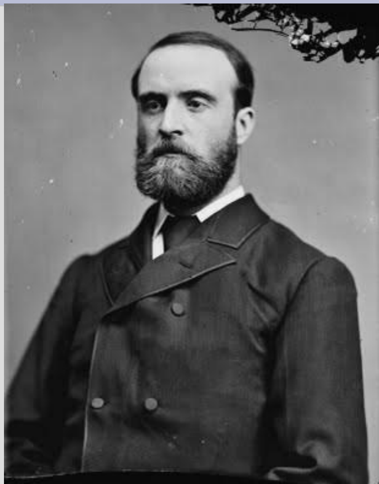
Чарльз Каннингэм Бойкот 1832 – 1897