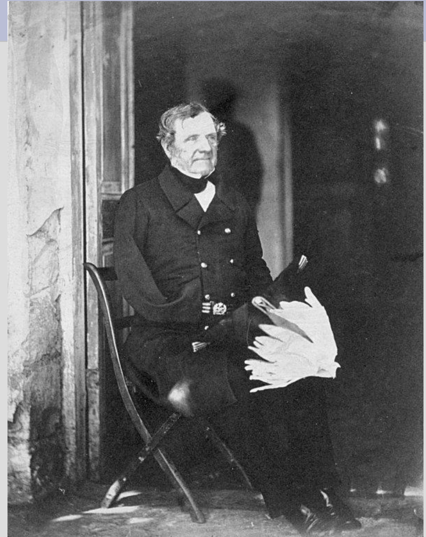
Фицрой Реглан 1788 - 1855