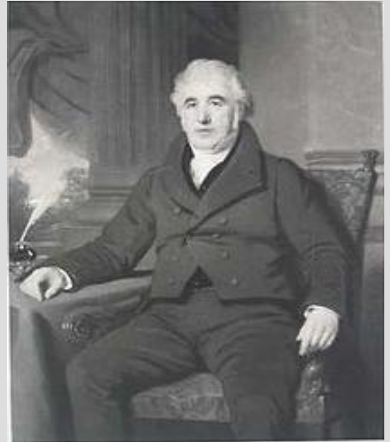
Чарльз Макинтош 1766 — 1843