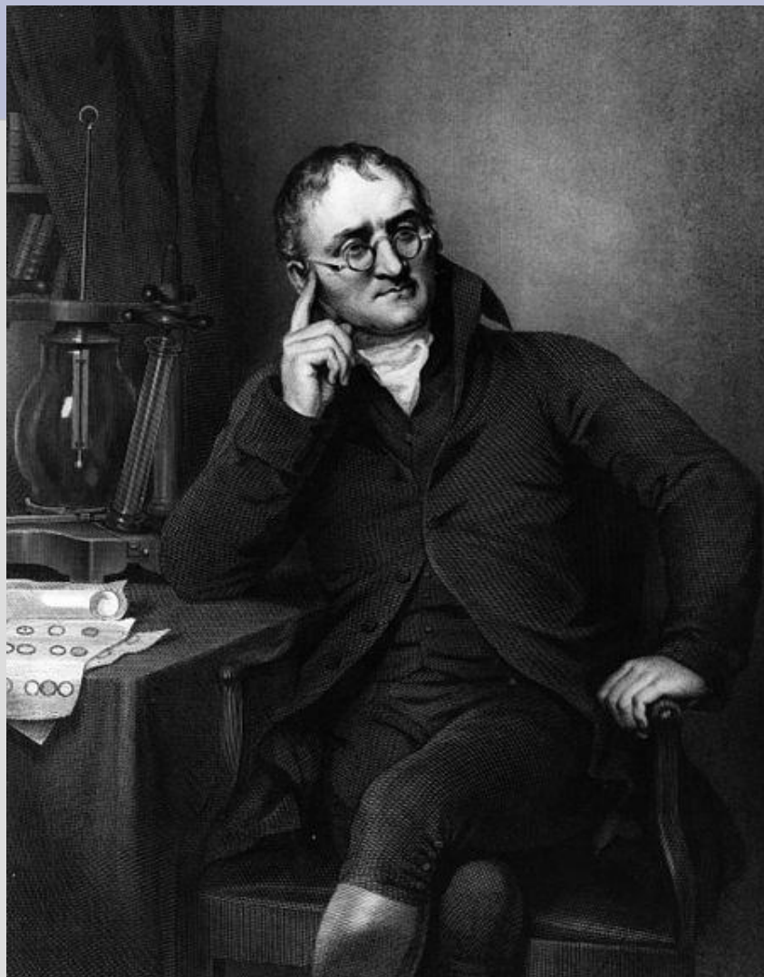
Джон Дальтон (1766 – 1844)