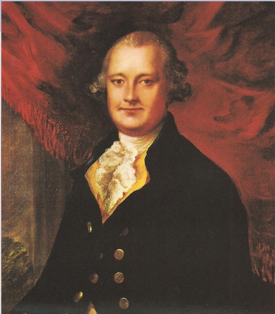
Эдвард Смит Стенли, 12й лорд Дерби 1752 - 1834