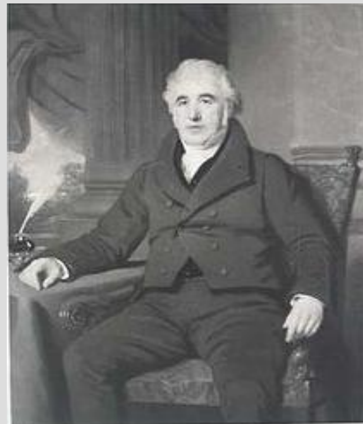
Чарльз Макинтош 1766 — 1843