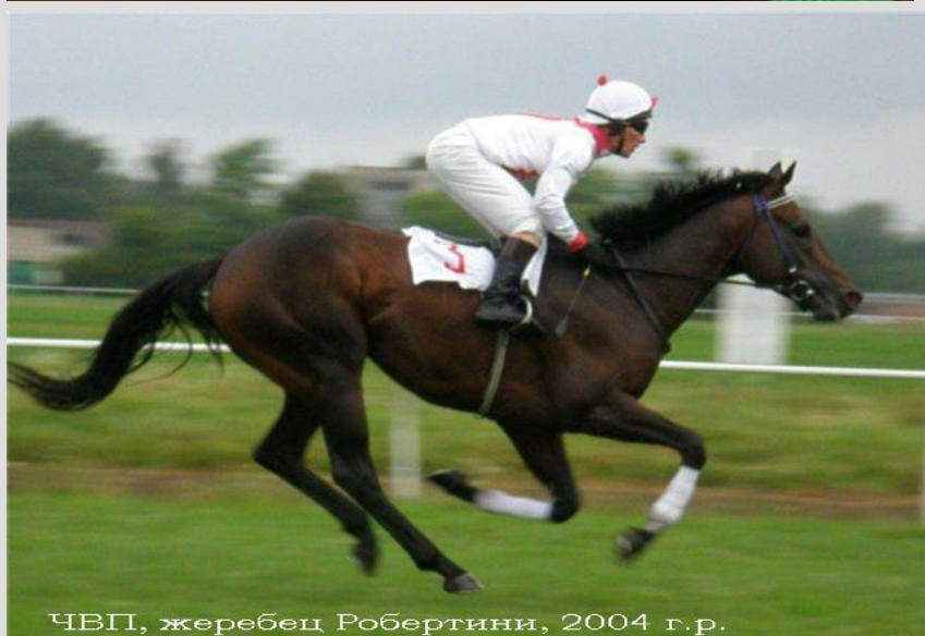
ЧВП, жеребец Робертини, 2004 г.р.