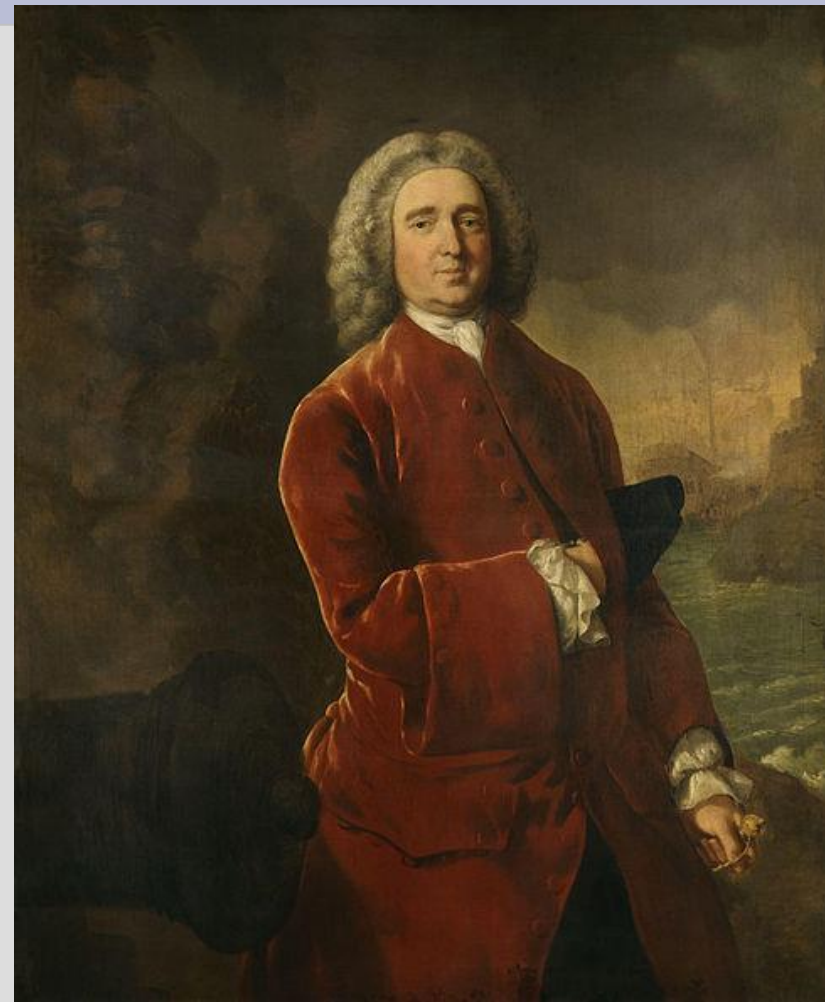
Эдвард Вернон 1684 – 1757)