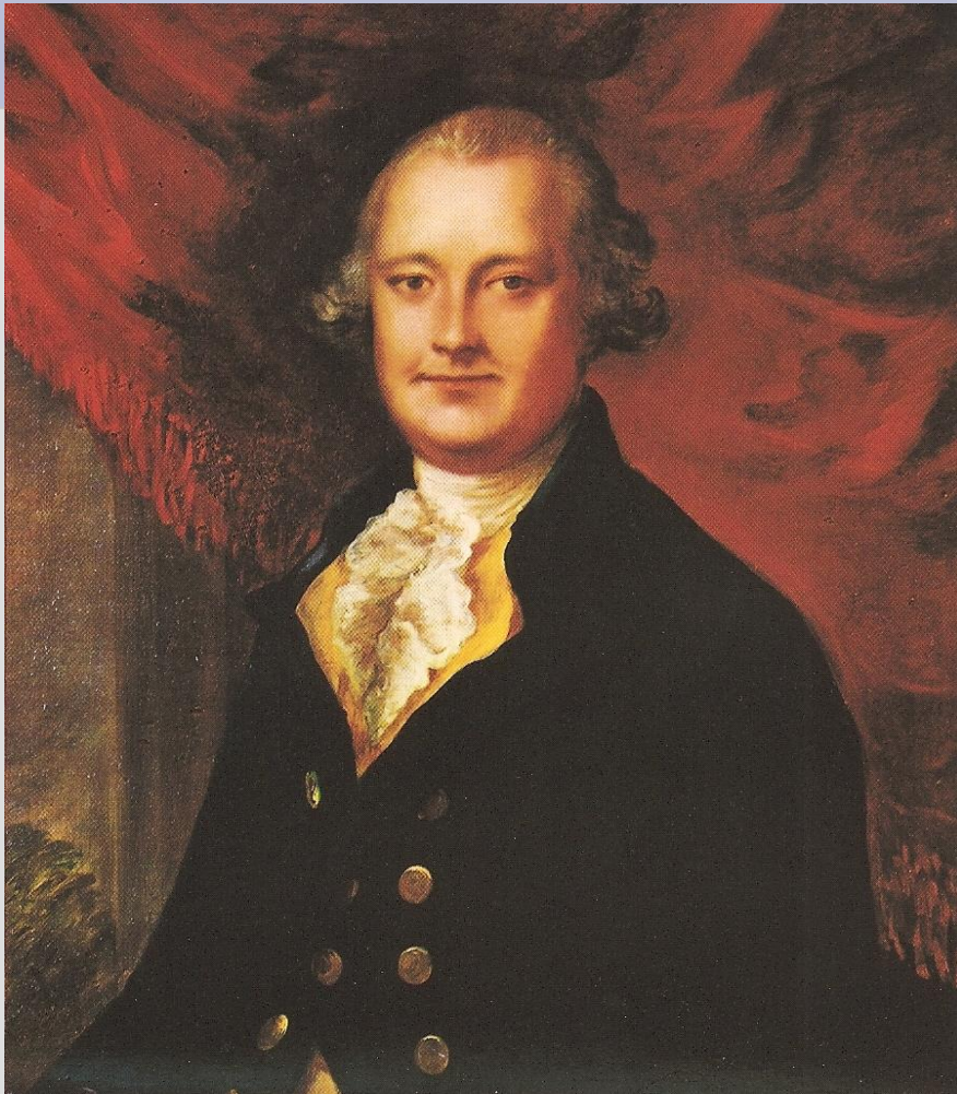
Эдвард Смит Стенли, 12й лорд Дерби 1752 - 1834