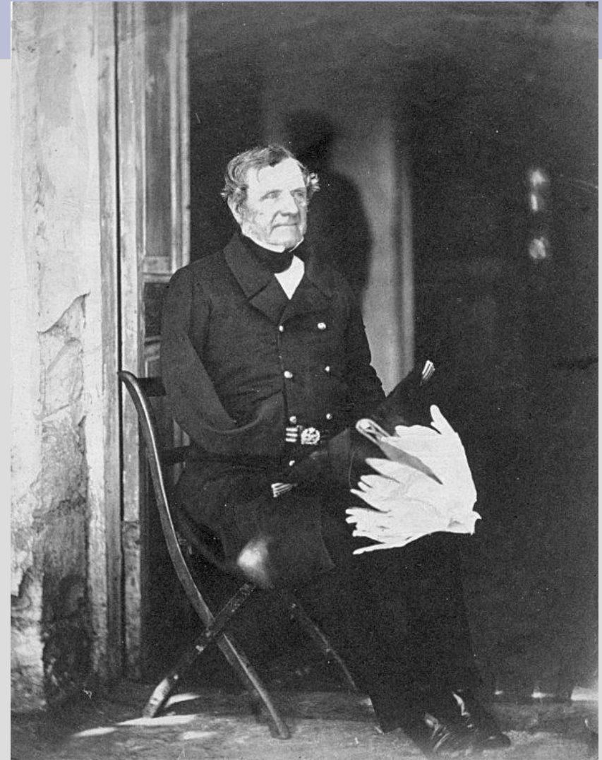
Фицрой Реглан 1788 - 1855