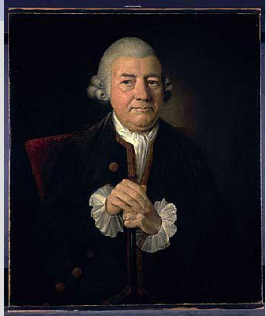
Джеймс Уотмен (1702 - 1754)