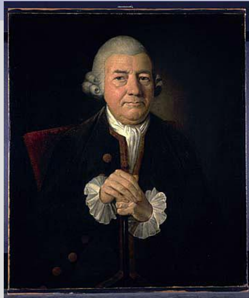
Джеймс Уотмен (1702 - 1754)