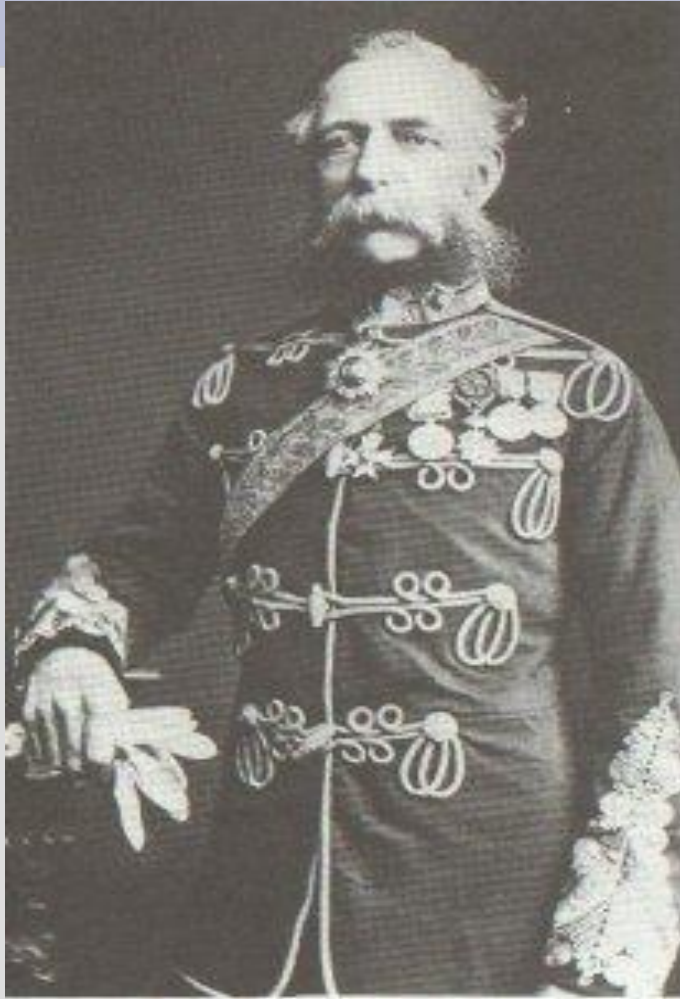
Джеймс Томас Брюднелл 1797 – 1868 7-й граф Кардиган