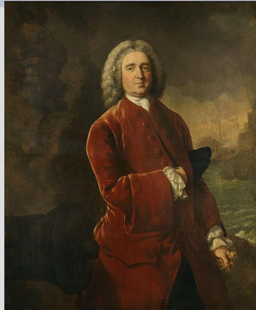
Эдвард Вернон 1684 – 1757)