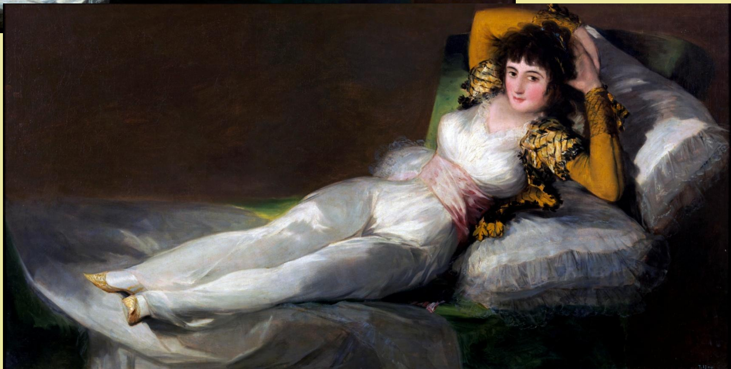
«Маха одягнена», 1802—1805.