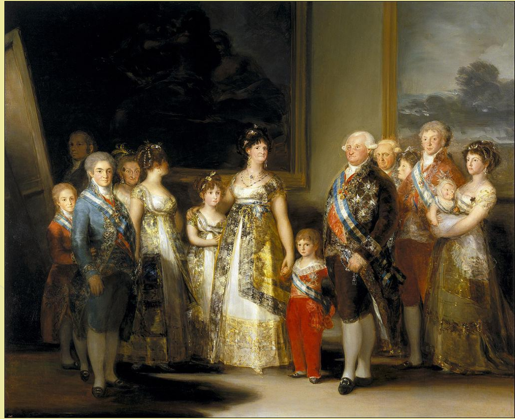
«Родина короля Карлоса IV»

У 1786 році Гойя був призначений художником при дворі Карлоса III, а у 1789 році — художником при дворі Карлоса IV. У 1795 році, після смерті Байеу Гойя став директором живописного відділення Королівської академії Сан -Фернандо .