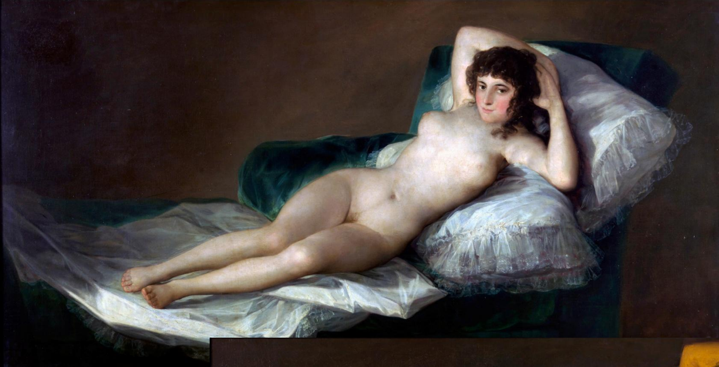
«Маха оголена», 1790—1800.