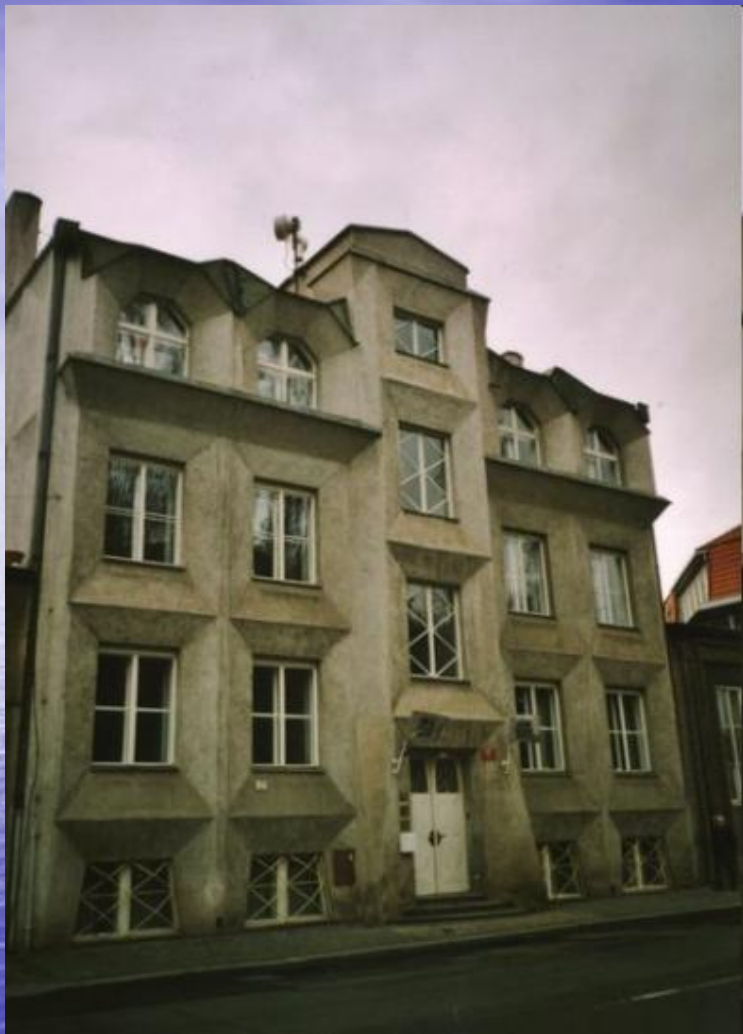
Maison de style cubiste à Prague, Tchéquie.