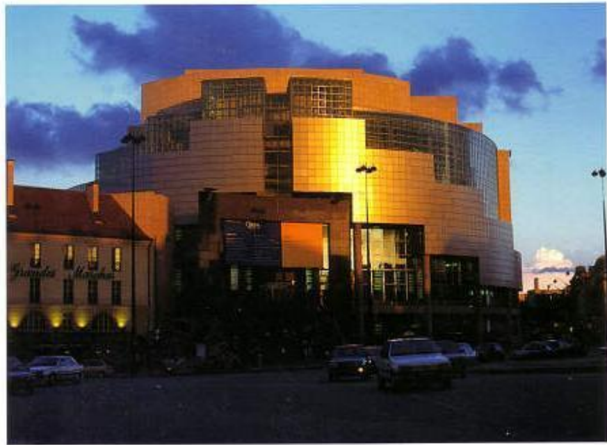
OPÉRA DE LA BASTILLE