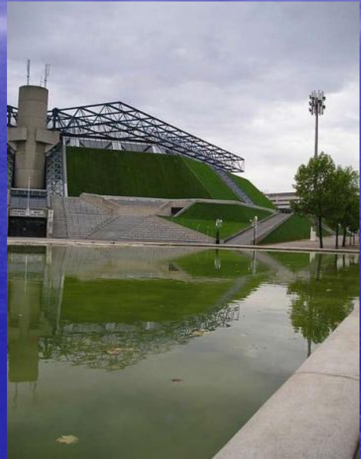
Bercy palais omnisports