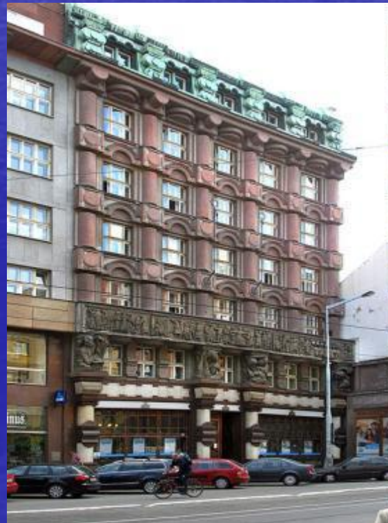
Exemple d'architecture rondocubiste : siège de la banque des légions tchèques