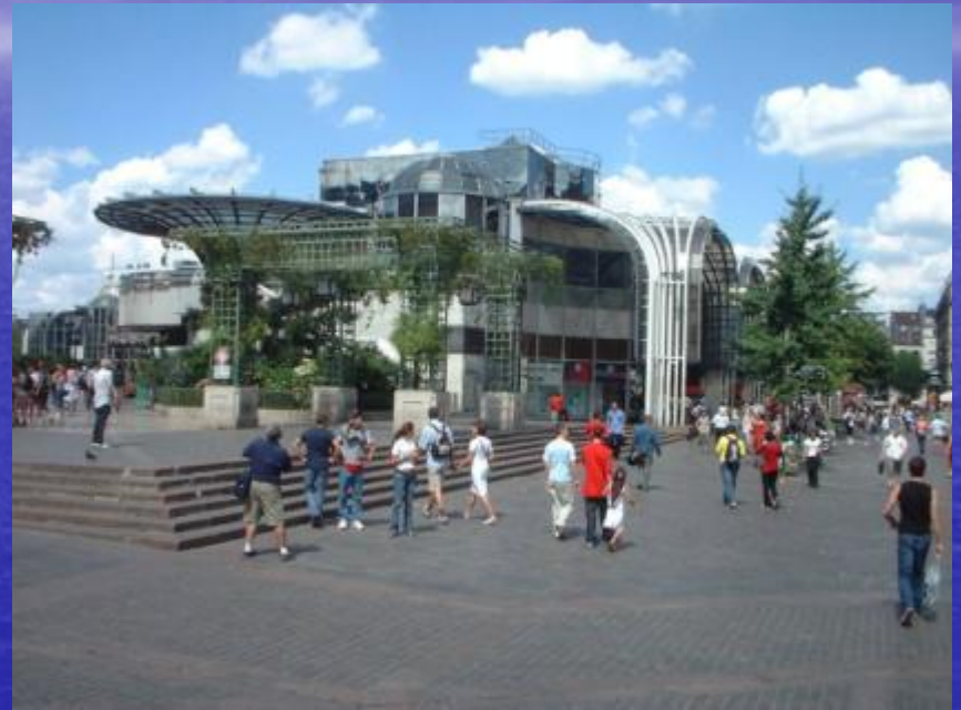
Vue du Forum des Halles