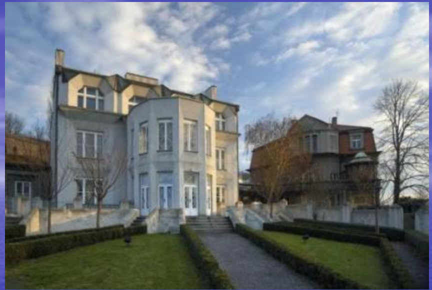
Villa cubiste à Prague