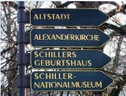
Weg nach Marbach

Friedrich Schiller wurde am 10. November 1759 in Marbach am Neckar geboren.