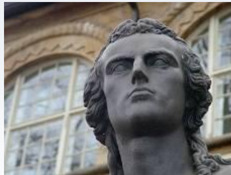
Schillerdenkmal in Jena