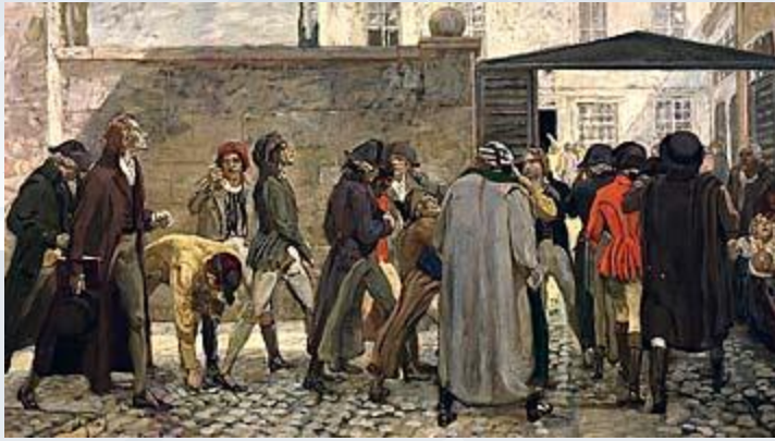
Gemälde der Universität Jena: Schiller auf dem Weg zur Antrittsvorlesung