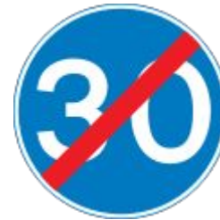
End of minimum speed requirement