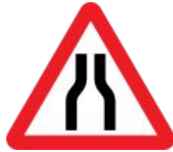
Road narrows on both sides ahead