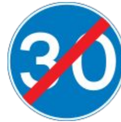
End of minimum speed requirement