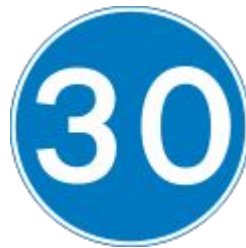
Minimum speed (in mph)