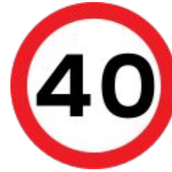
Legal speed limit (in mph)