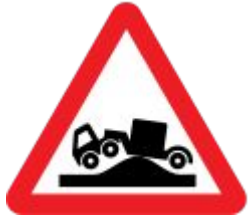
Risk of grounding for lorries