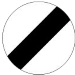
National speed limit applies