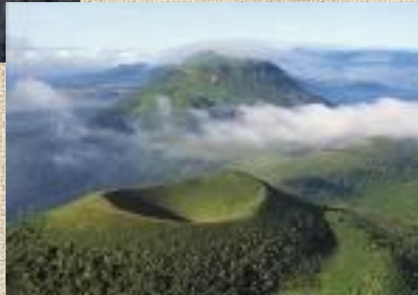
Le Massif Central