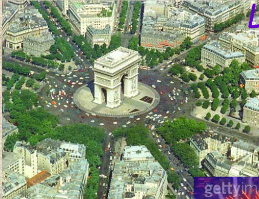
L'Arc de Triomphe