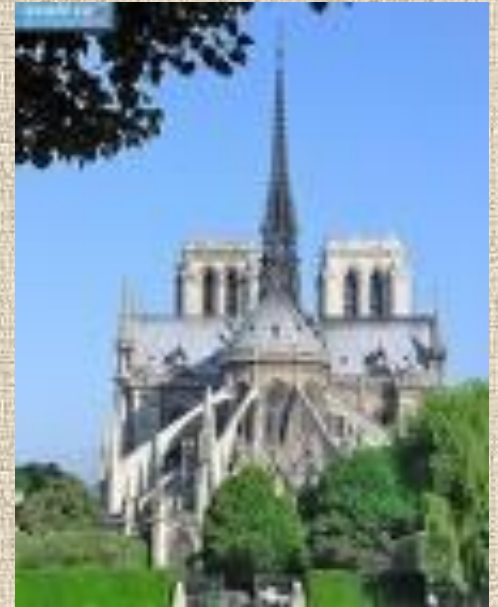
Notre-Dame de Paris