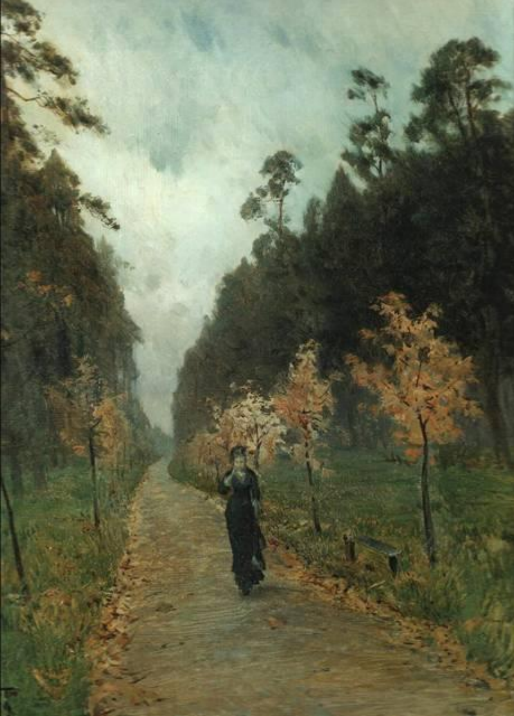
И. Левитан. Осенний день в Сокольниках. 1879