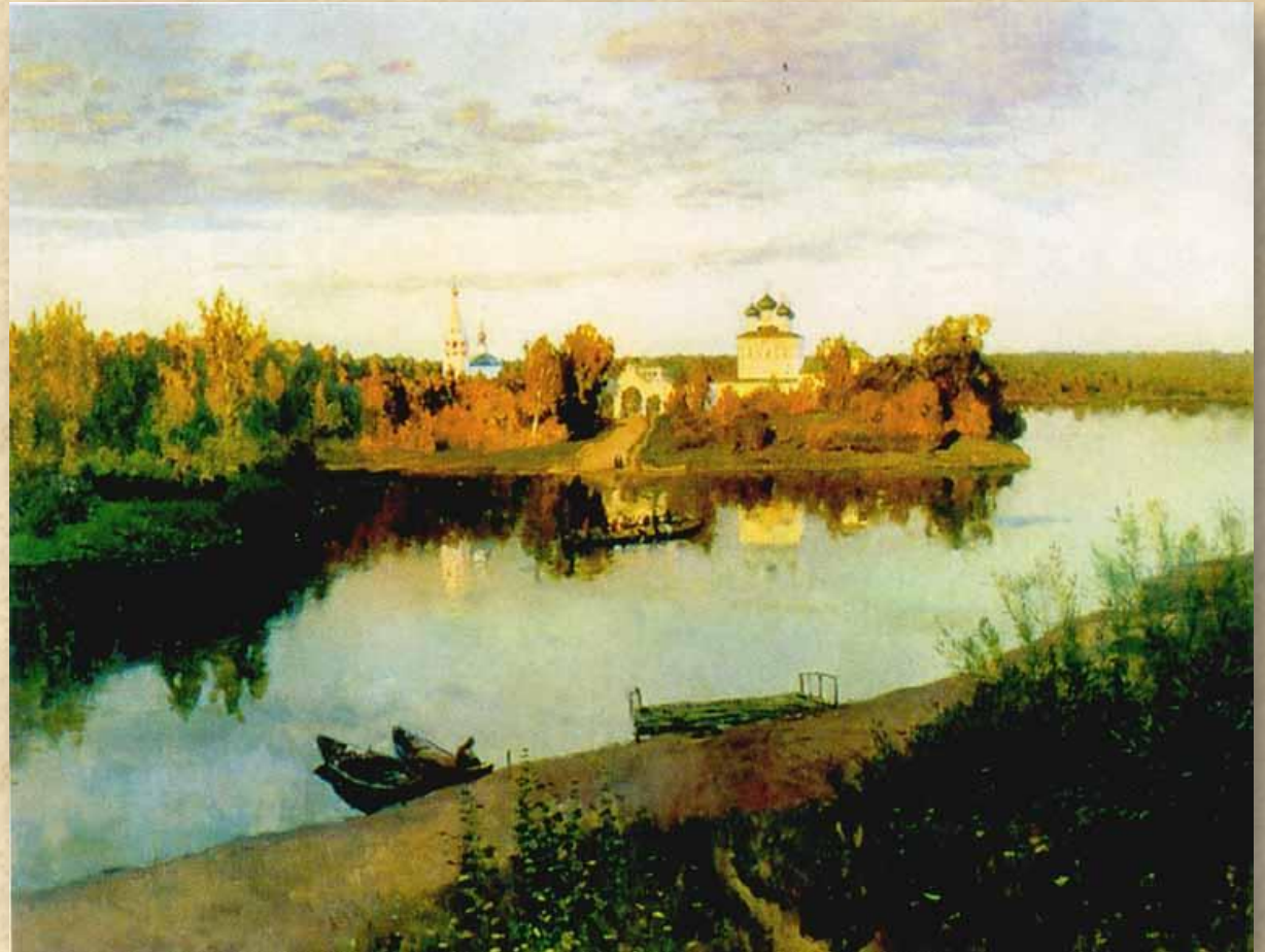
И.Левитан. Вечерний звон