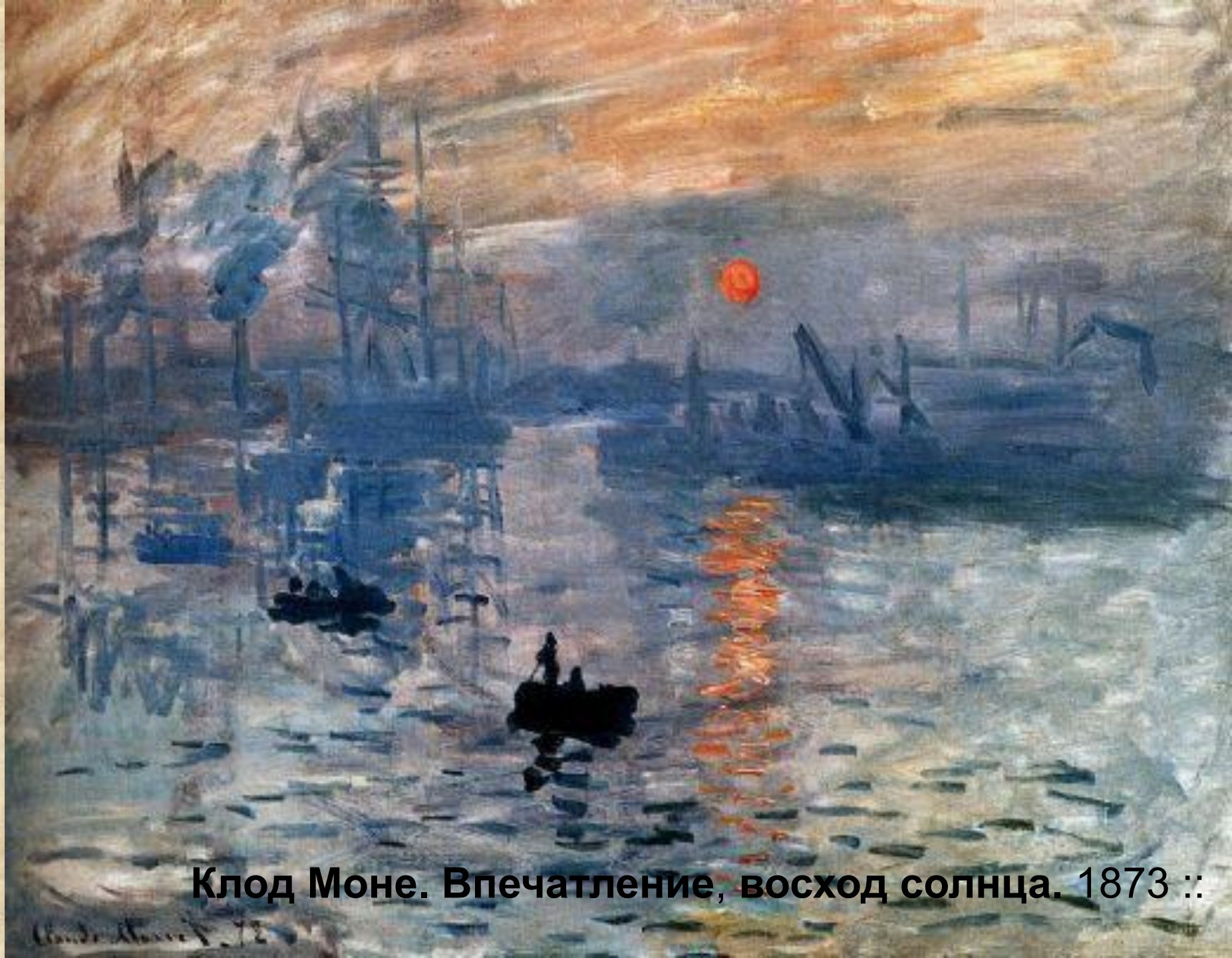
Клод Моне. Впечатление, восход солнца. 1873 ::