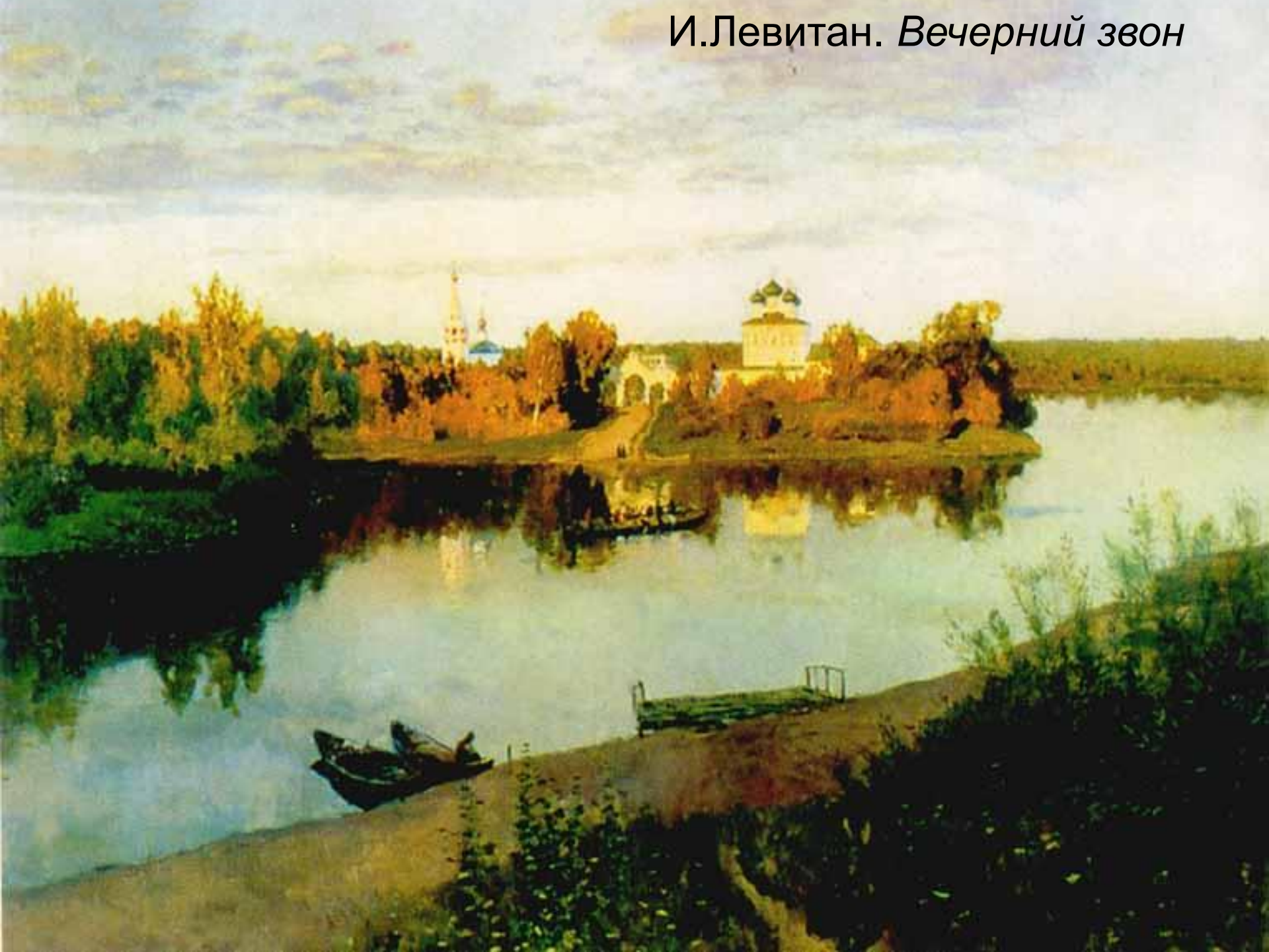
И.Левитан. Вечерний звон