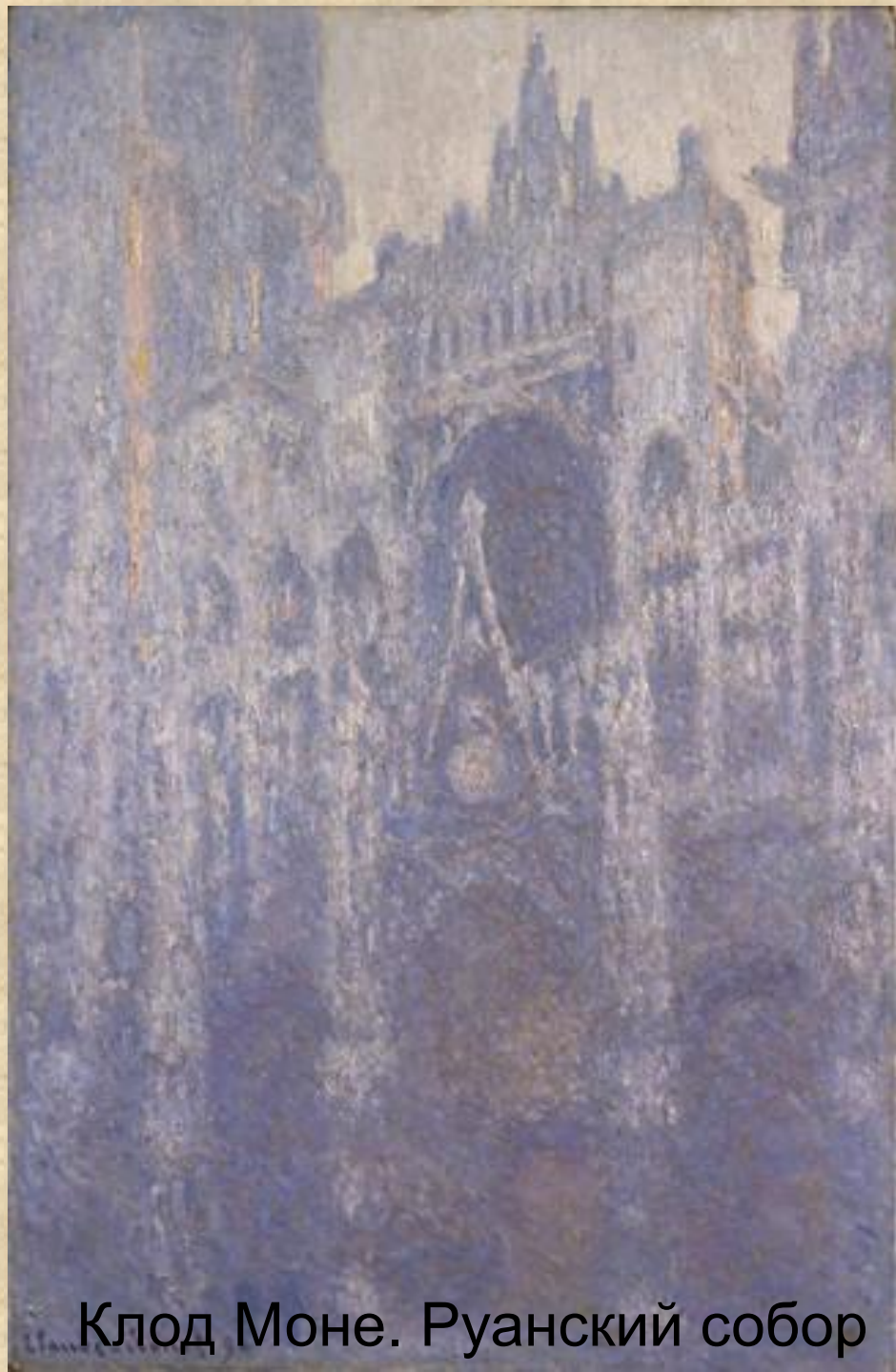
Клод Моне. Руанский собор