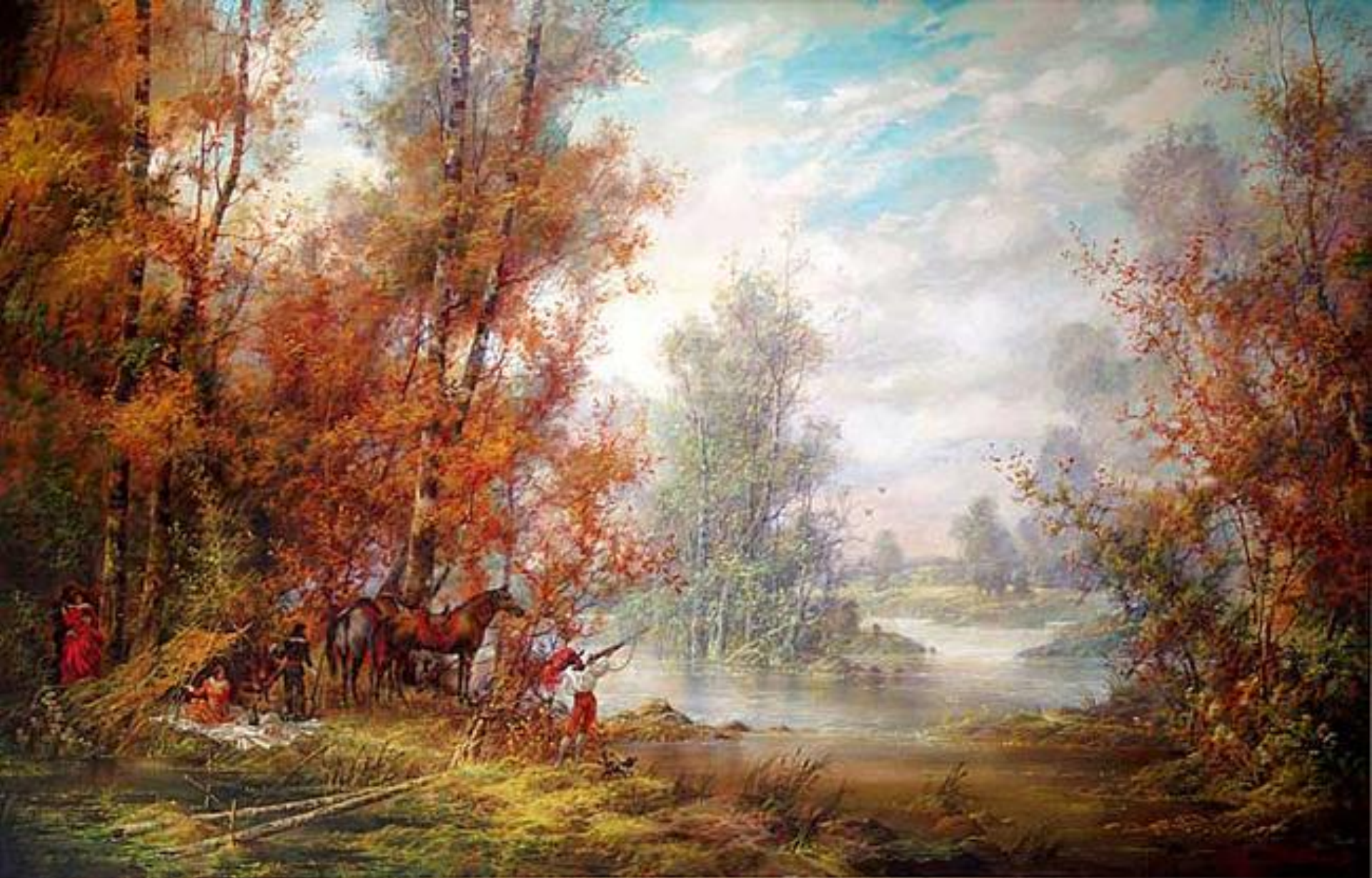
Головин Константин. Осенняя охота.