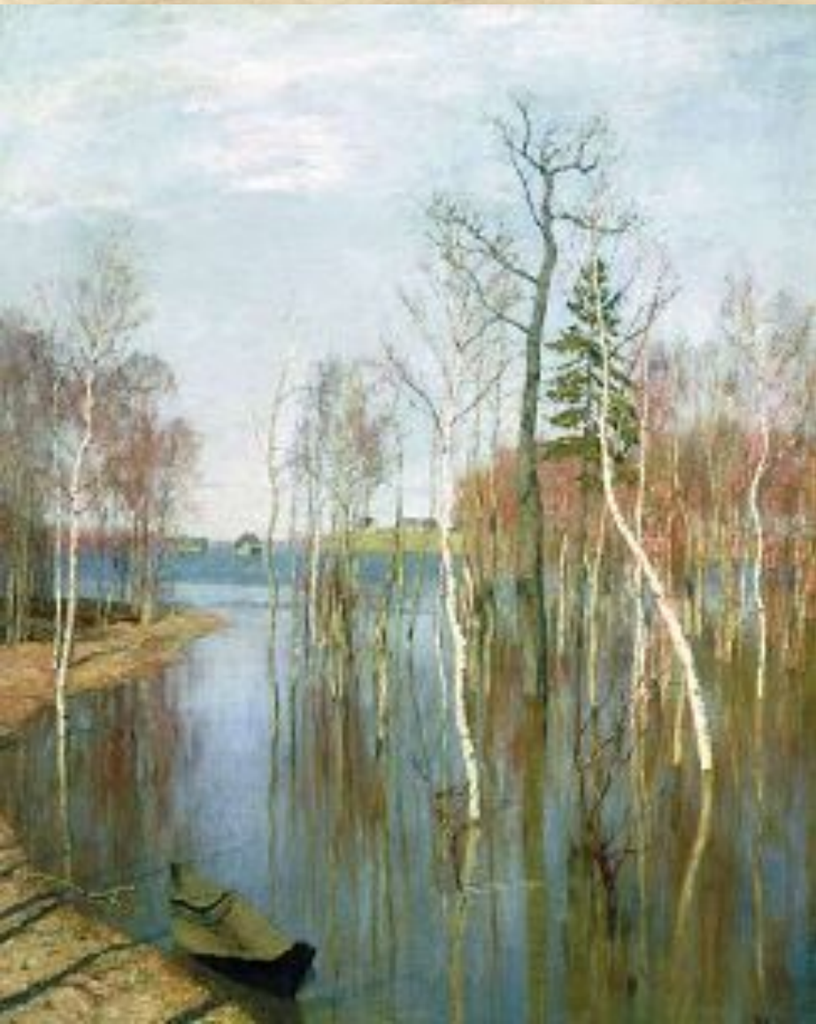
И. Левитан. Весна. Большая вода

Вот какими словами описал свои впечатления от картины знаток русской живописи М. Алпатов: