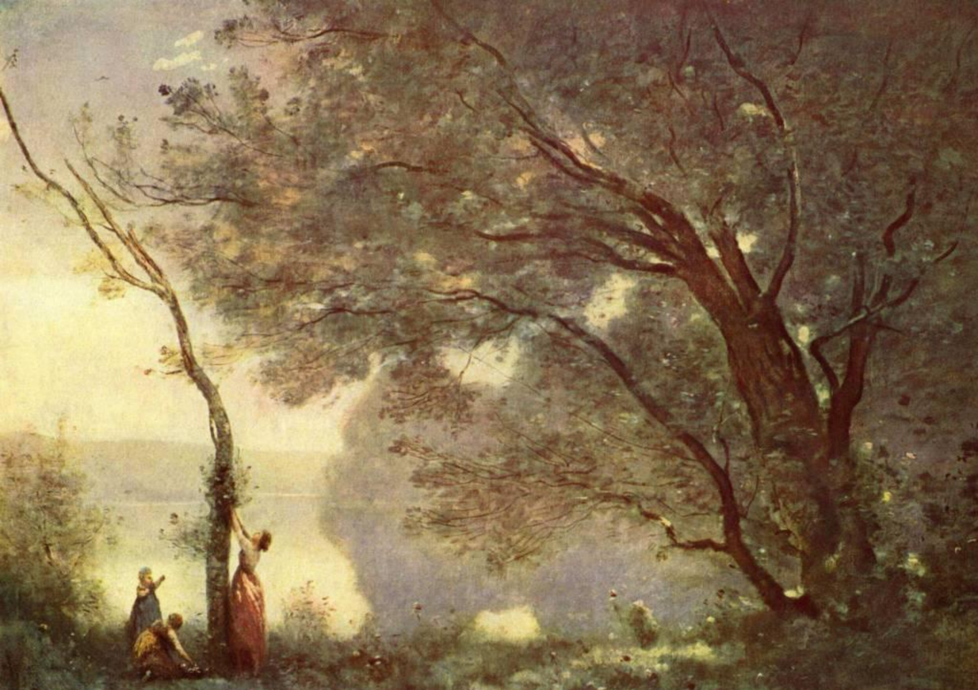
Воспоминание о Мортефонте. 1864