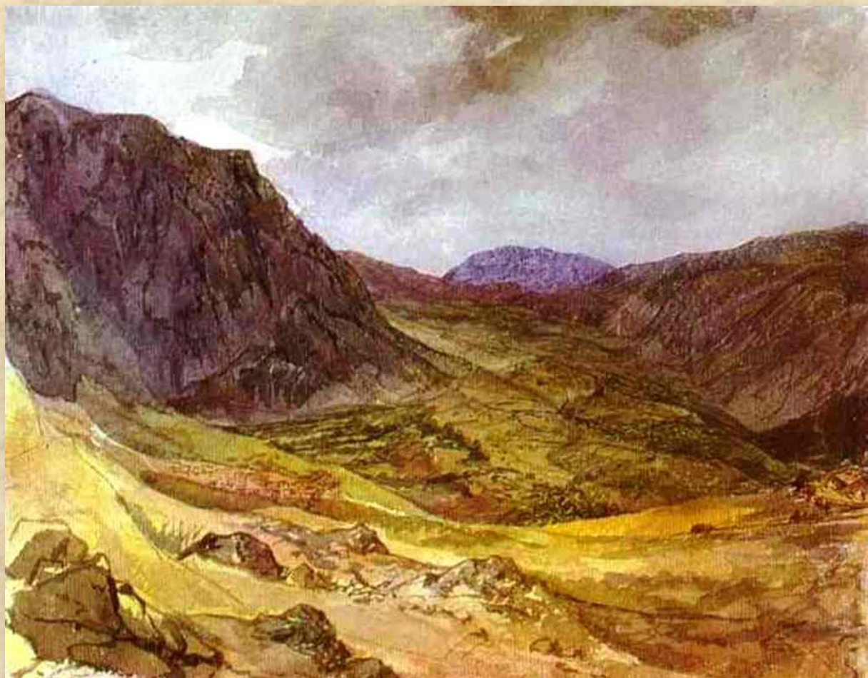
Путешествие в Грецию.