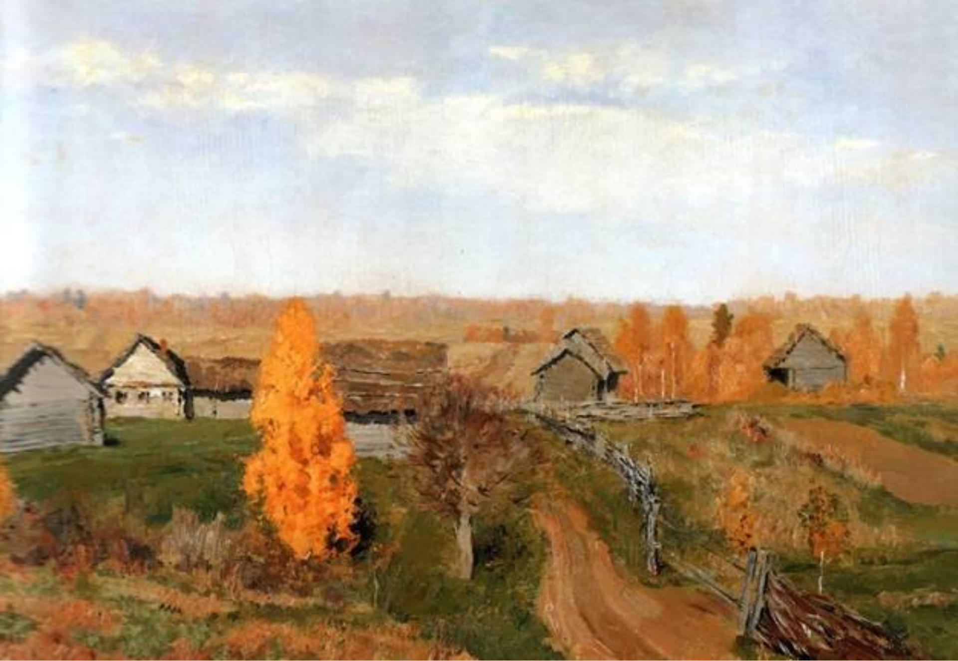
И. Левитан. Золотая осень. Слободка. 1889 год