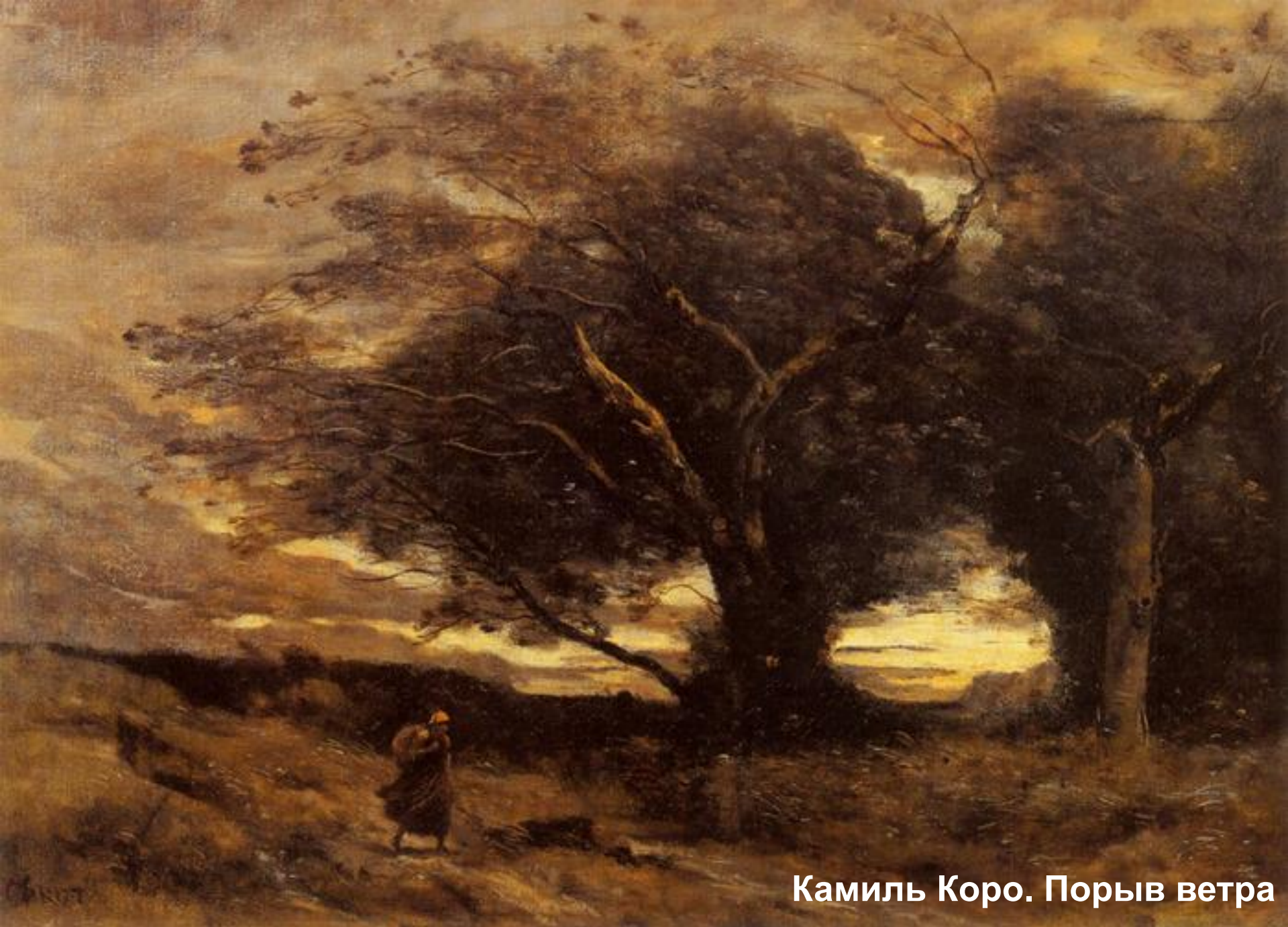
Камиль Коро. Порыв ветра