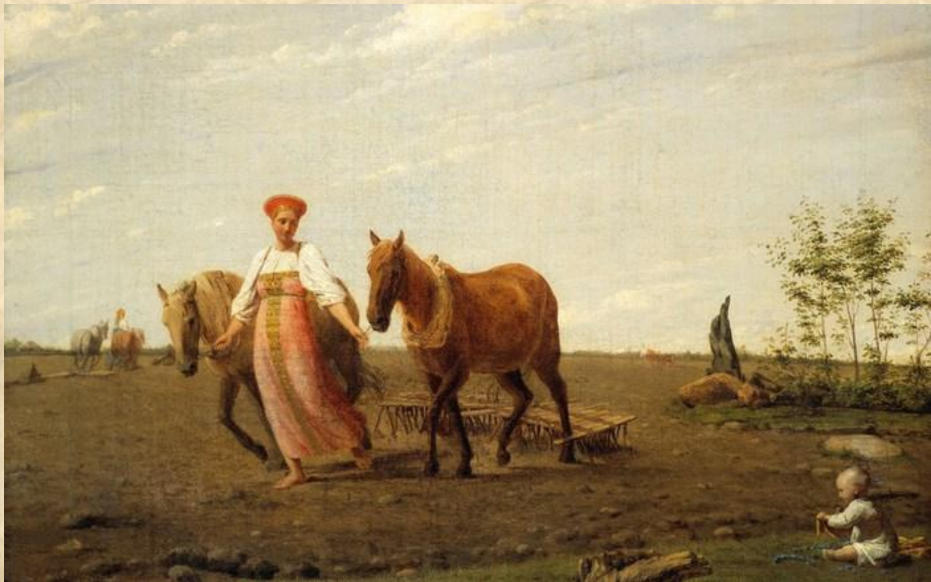
На пашне. Весна, 1820