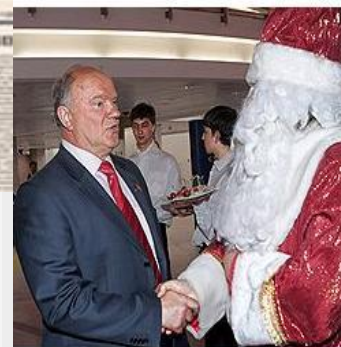
Геннадию Зюганову (слева) пришлось общаться не только с девушками, но и с дедушками