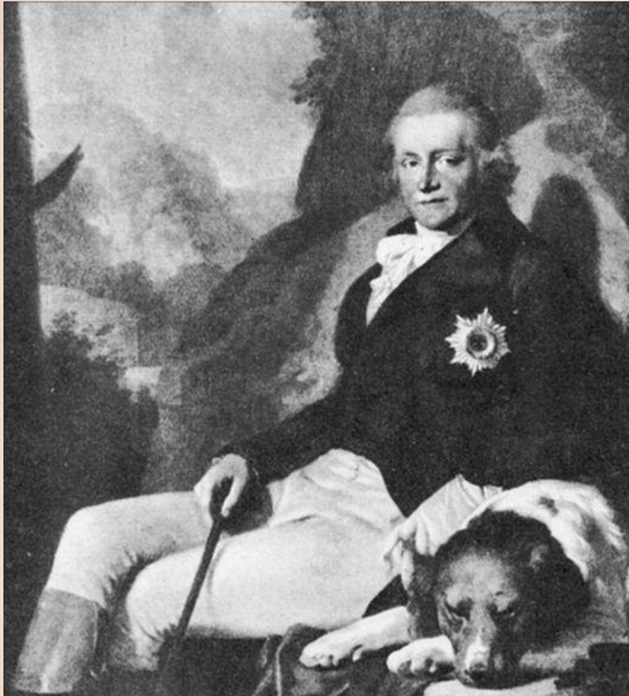
Herzog Karl-August von Weimar

1775 berief der junge Herzog Karl-August von Weimar Goethe als Minister an seine Residenz. Für den Dichter begann jetzt ein Leben strenger Pflichterfüllung im Dienst des kleinen Herzogtums.