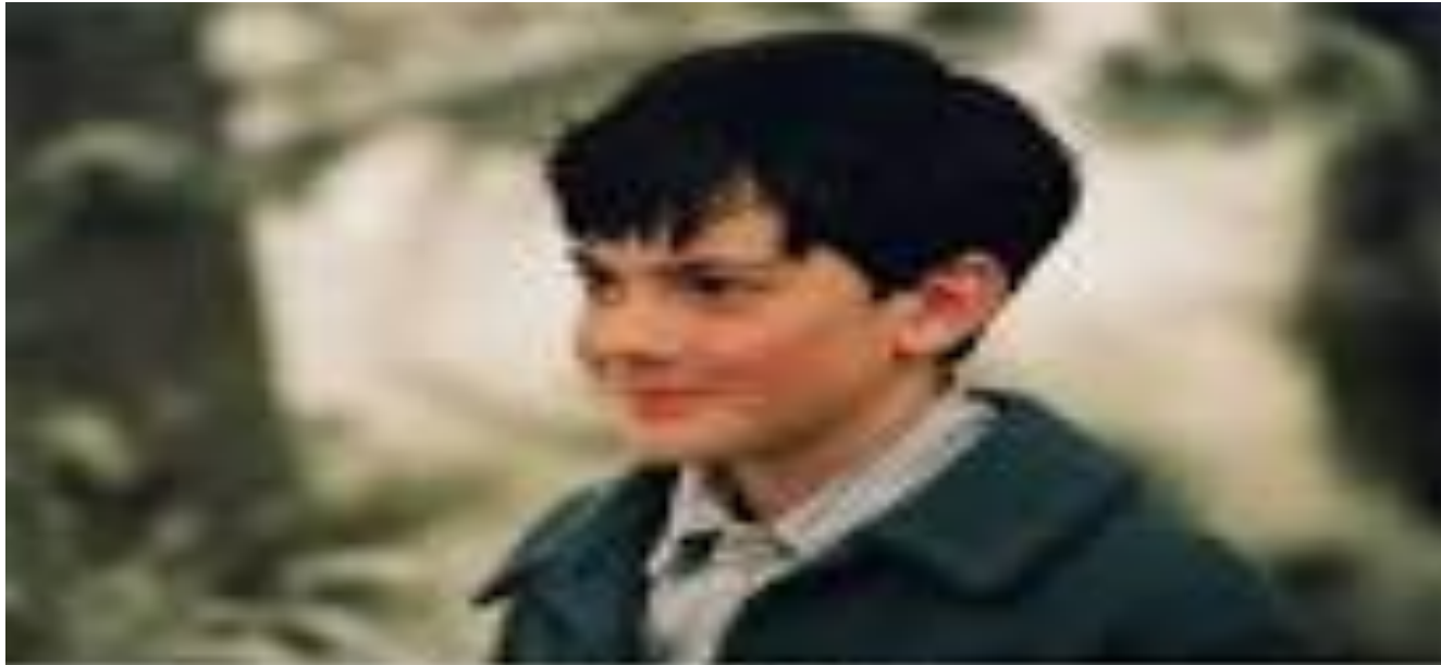
У него тёмные волосы.

He has got =he's got – У него есть (Он имеет) У него тёмные волосы.