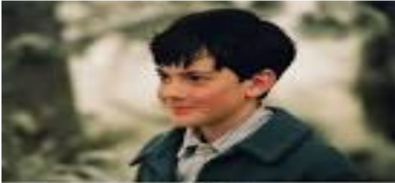
У него тёмные волосы.

He has got =he's got – У него есть (Он имеет) У него тёмные волосы.