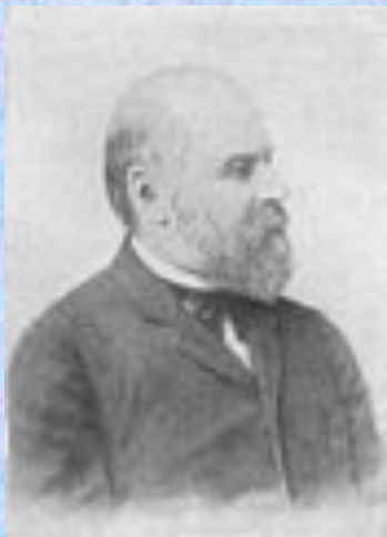
М. А. Балакирев

К середине 1870-х годов «Могучая кучка» как сплочённая группа перестала существовать. Деятельность «Могучей кучки» стала эпохой в развитии русского и мирового музыкального искусства.