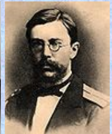
Н. А. Римский-Корсаков