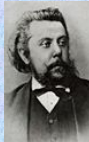
М. П. Мусоргский