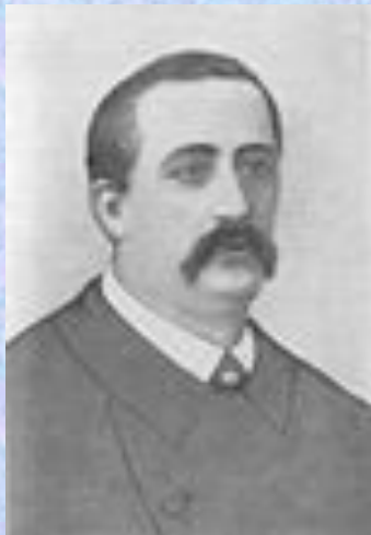
А. П. Бородин