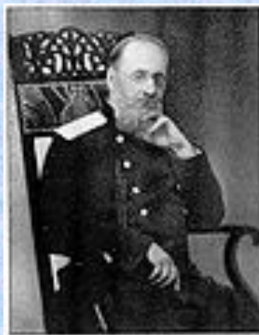
Ц. А. Кюи