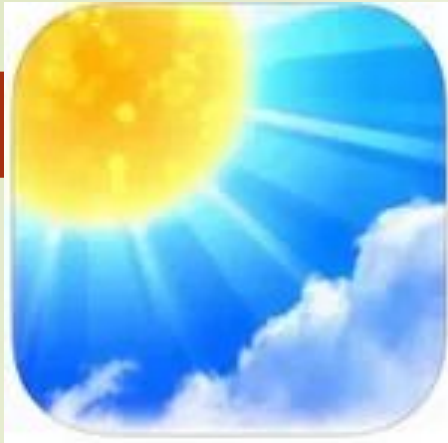
Sun is shining