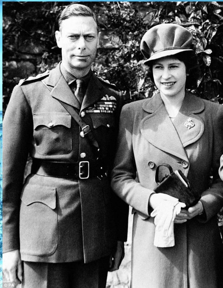
Принцесса Елизавета с отцом.

Король Георг VI умер 6 февраля 1952 года. Елизавета, находившаяся на отдыхе в Кении, была провозглашена королевой.