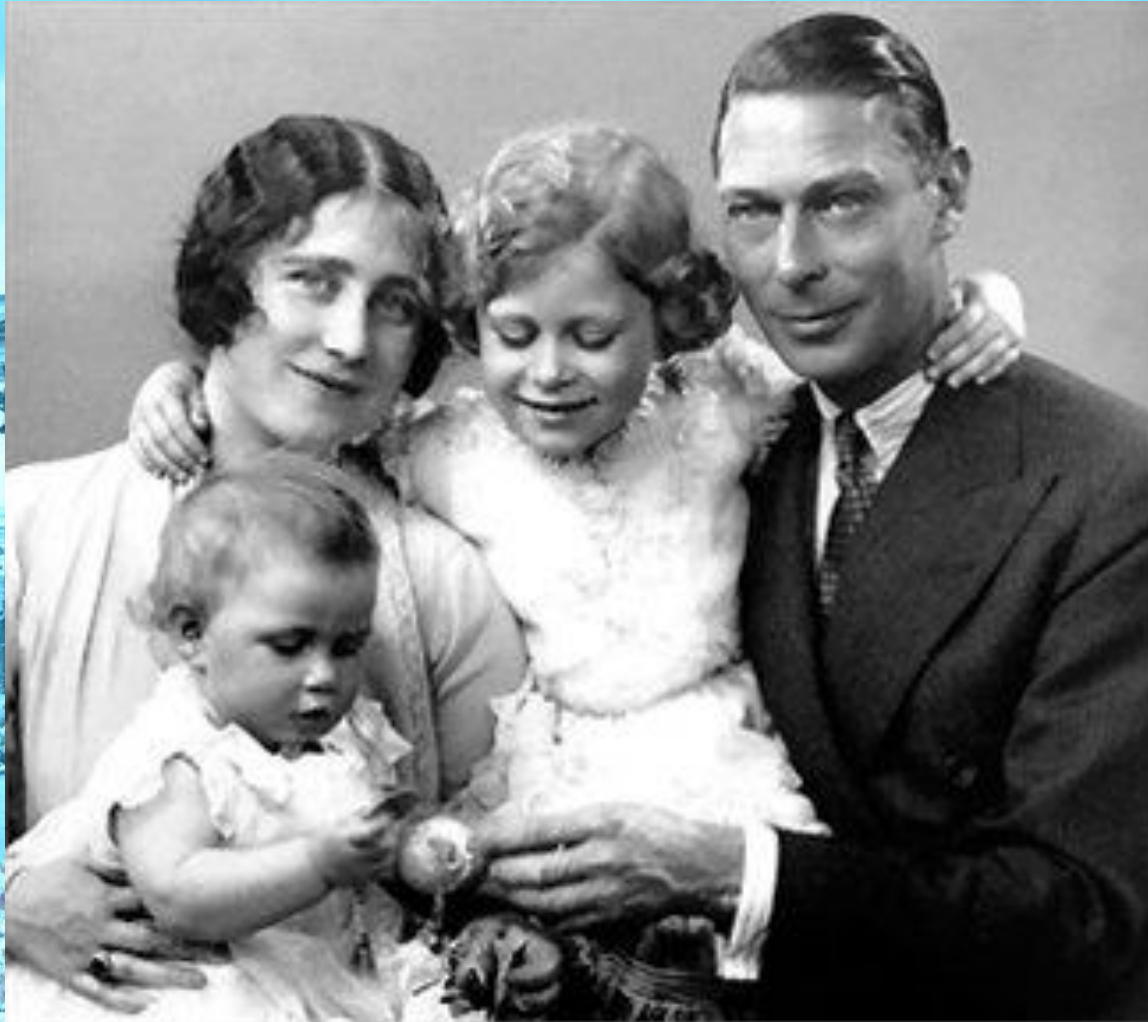
Принц Альберт, леди Елизавета Боуз-Лайон и их дочери Елизавета и Маргарет

Личность Елизаветы II сформировывалась на фоне всеобщей заботы и любви. С раннего детства ее воспитанию и образованию уделялось огромное внимание.