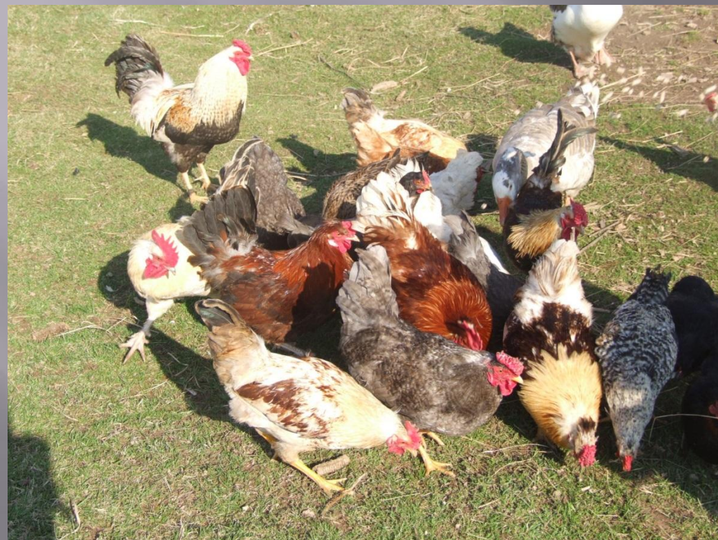
Vistas un gaiļi