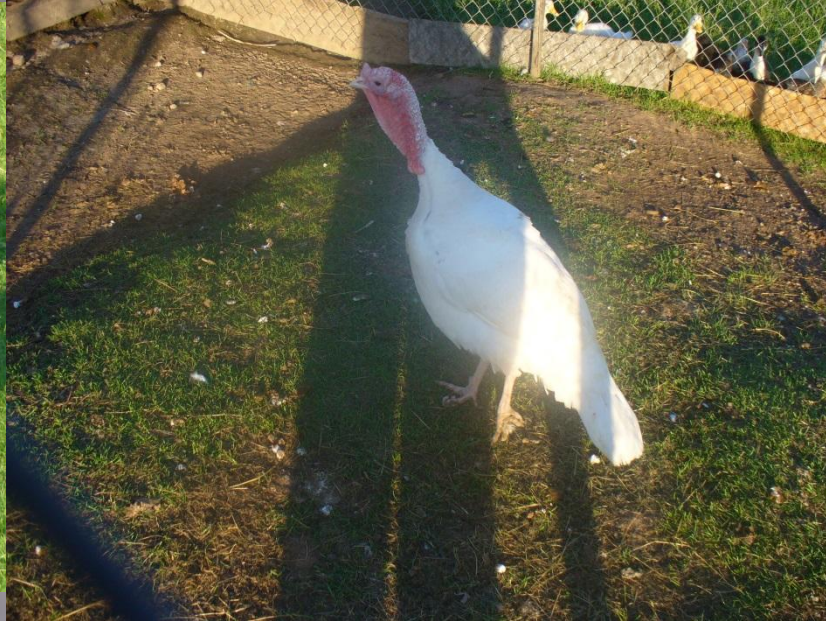
Tītari baltie un pelēkie