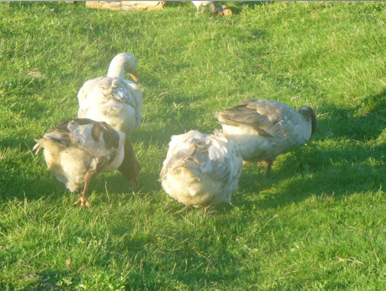
Lenta zosis un parastžās zosis