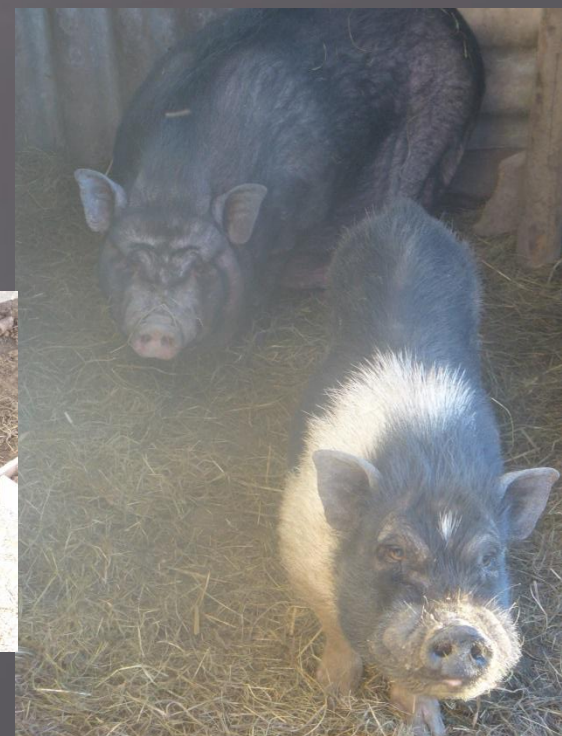
vjetnamas minī cūciņas