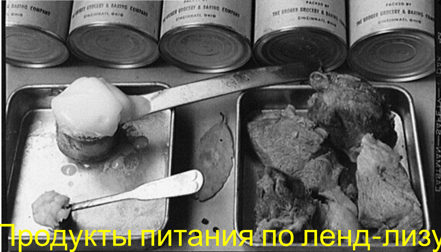
Продукты питания по ленд-лизу